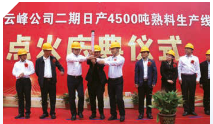
湖南雲峰二期日產4500噸熟料生產線點火儀式