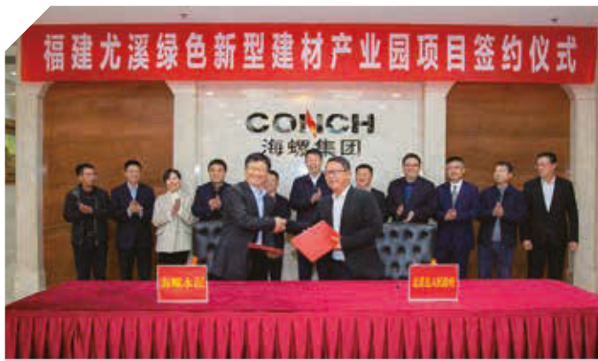
福建尤溪綠色新型建材產業園項目簽約儀式