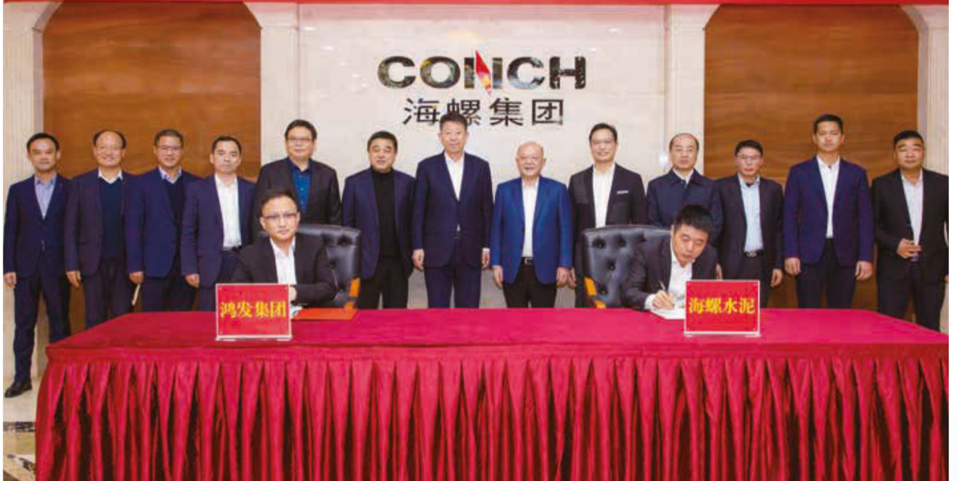
廣東鴻豐水泥項目簽約儀式