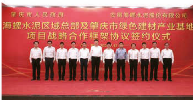
海螺水泥區域總部及肇慶市綠色建材產業基地項目戰略合作框架協議簽約儀式