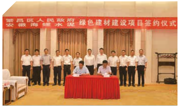
綠色建材建設項目簽約儀式