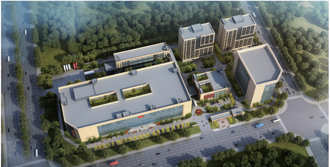
位於惠州陳江之新型顯示模組智能工廠

面對較為複雜的宏觀環境以及競爭激烈的智能設備市場，本集團持續改善自身的競爭力。除不時投入新設備及進行自動化產能提升外，本集團位於惠州陳江的新型顯示模組智能工廠亦於二零二一年第三季度建設封頂，預期於二零二二年第二季度開始試運行並開展客戶認證評估工作。隨著新廠房逐步投產，本集團相信能有助提升生產技術發展及增加產能，通過規模經濟優勢以捕捉全球經濟市場好轉所帶來的商機。