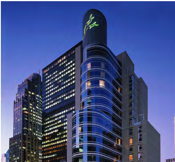
Sofitel New York, USA 美國紐約索菲特酒店