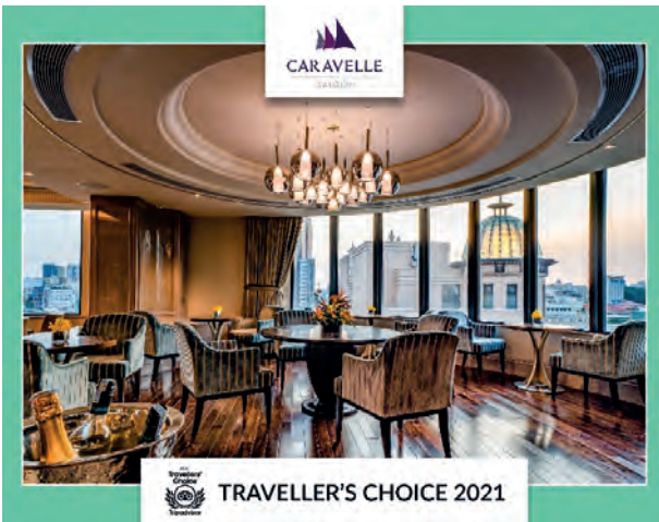
2021 Tripadvisor Travelers' Choice 貓途鷹頒發的二零二一年旅行者之選

Caravelle Saigon Hotel, Vietnam 越南胡志明市帆船酒店