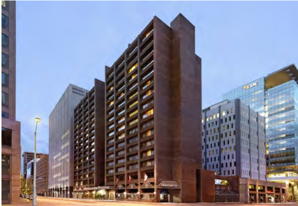
Sheraton Ottawa Hotel, Canada 加拿大渥太華喜來登酒店