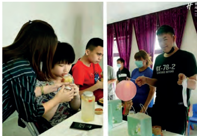
Giving for good 2021 2021傳遞美好月 — 探訪兒童康服中心

Sheraton Ottawa Hotel, Canada 加拿大渥太華喜來登酒店