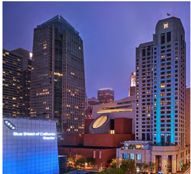
W Hotel San Francisco, USA 美國三藩市W酒店