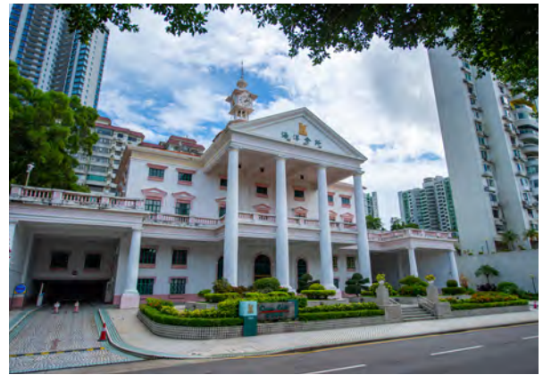
Ocean Club, Macau 澳門海洋會所