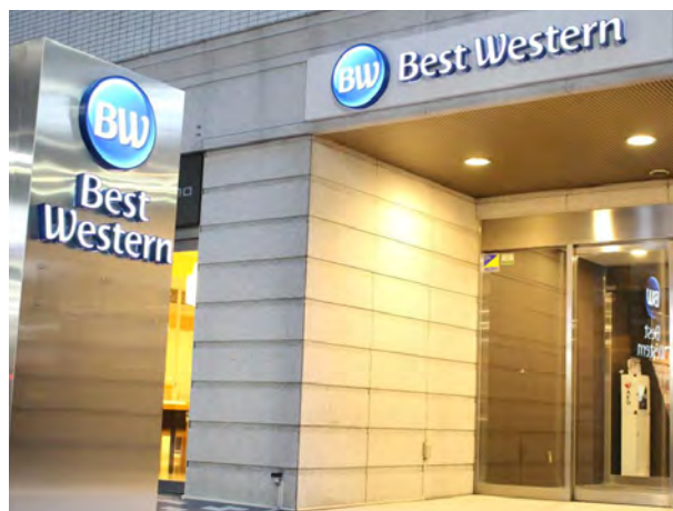
Best Western Osaka Hotel, Japan 日本大阪心齋橋西佳酒店