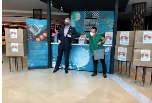
Moon Cake to Doctor of front line against epidemic 贈送月餅予對抗疫情前線醫生

Caravelle Saigon Hotel, Vietnam 越南胡志明市帆船酒店