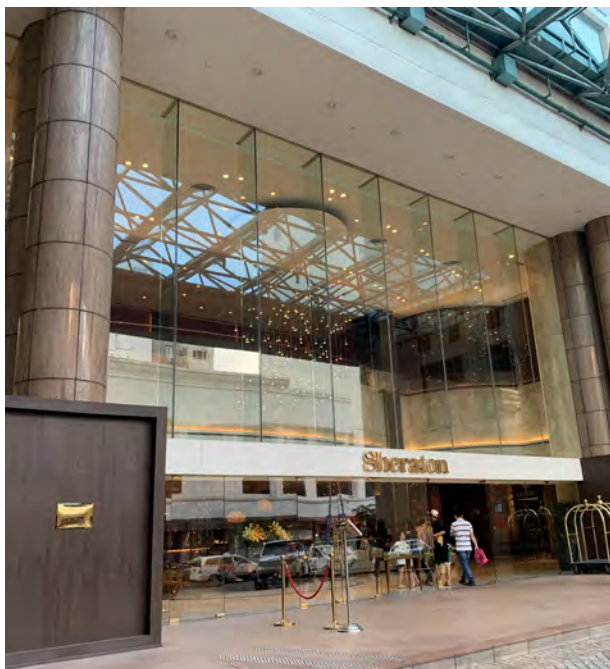
Sheraton Saigon Hotel & Towers, Vietnam 越南胡志明市西貢喜來登酒店