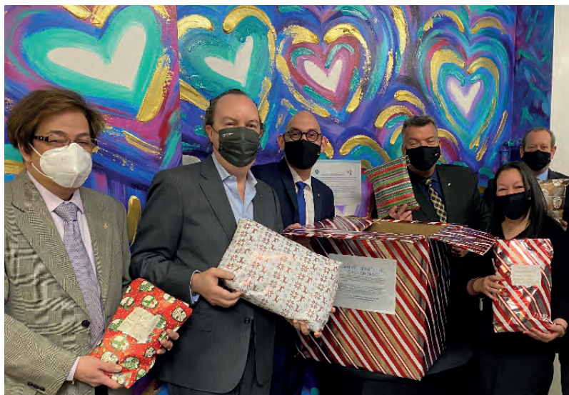
Winter Warm Essentials 冬季送暖行動