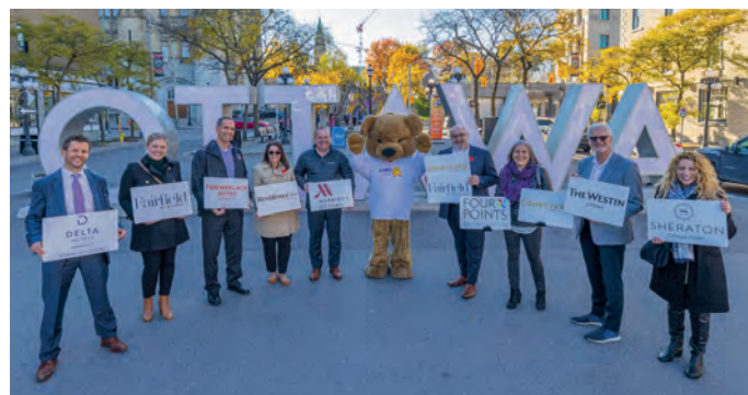
Fundraising for CHEO Foundation CHEO基金會籌款活動

Sheraton Ottawa Hotel, Canada 加拿大渥太華喜來登酒店