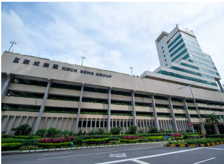
Ocean Tower, Macau 澳門海洋大廈