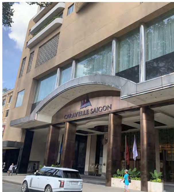
Caravelle Saigon Hotel, Vietnam 越南胡志明市帆船酒店