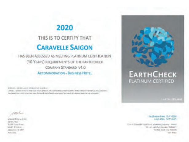
EARTHCHECK Platinum Certified EARTHCHECK 白金認證