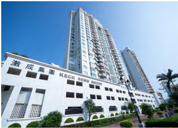
Ocean Gardens, Macau 澳門海洋花園