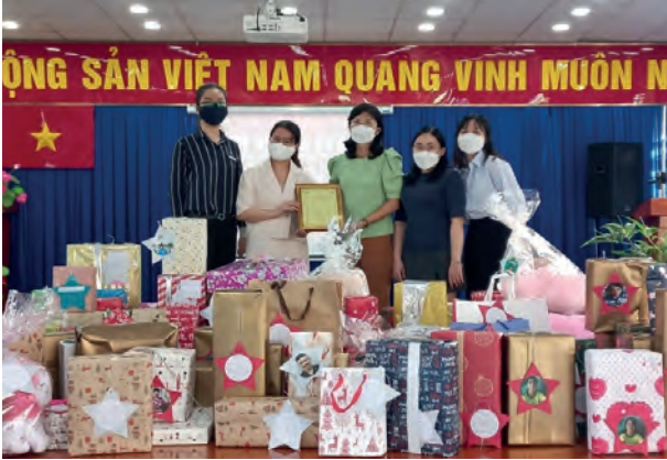
Wish Upon A Star Gifts to Binh Chanh Development Support Center Integrated Education 贈送許願星禮物予平政縣綜合教育發展支援中心

Sheraton Saigon Hotel & Towers, Vietnam 越南胡志明市西貢喜來登酒店