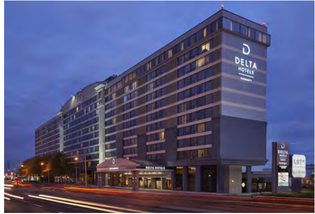
Delta Hotels by Marriott Toronto Airport & Conference Centre, Canada 加拿大多倫多機場會議中心德爾塔萬豪酒店