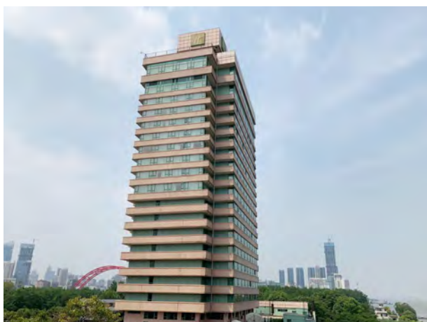
Holiday Inn Wuhan Riverside, China 中國武漢晴川假日酒店