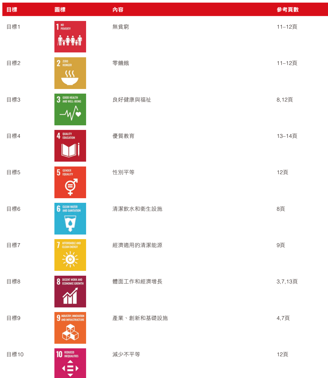
聯合國可持續發展目標對照表