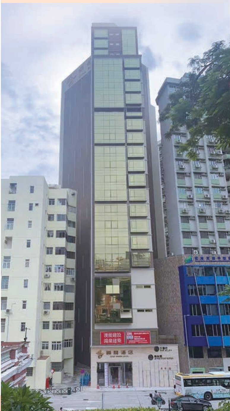
位於澳門馬統領巷5-11號一幅土地的酒店的建築工程