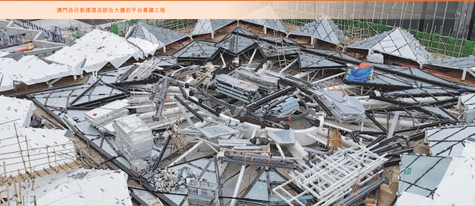
澳門氹仔新建酒店綜合大樓的平台幕牆工程