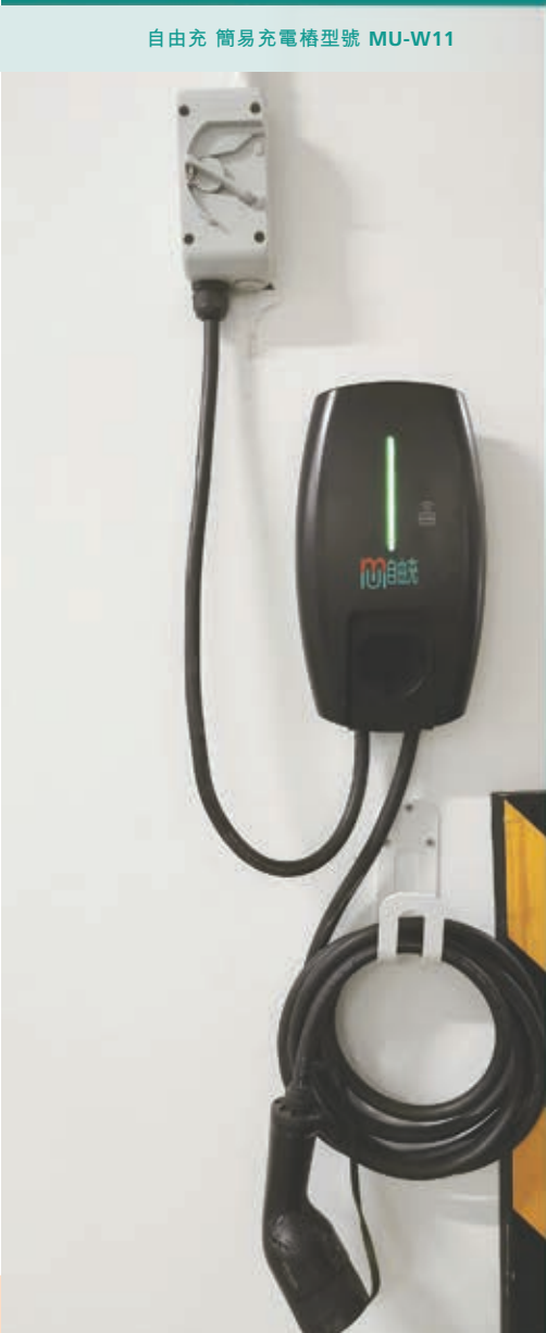
自由充 簡易充電樁型號 MU-W11