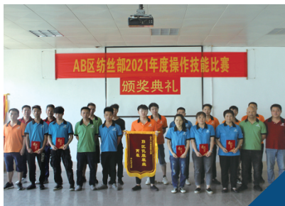
2021年度操作技能競賽

2021年度，公司舉辦和參加各類技能培訓及競賽包括：焊工培訓、西門子PLC培訓、動力部內技能培訓、AB區紡絲操作技能競賽、聚合紡絲設備部技能操作競賽、省百萬職工「五小」創新大賽、工業絲操作技能競賽、晉江市第二屆電工技能競賽等。參加的講座和活動包括：泉州師院座談會、企業新型學徒班培訓座談會、化纖技術講座、晉江企業創新發展大會、全國紡織創新大會、世界智能製造大會、行業標準專家審查會等。