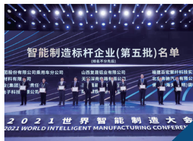
2021年世界智能制造大會