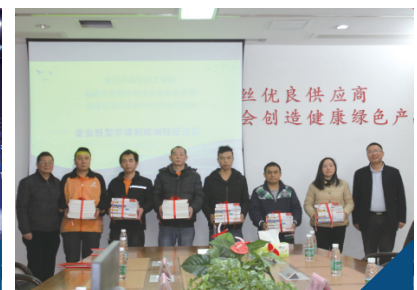
2021年学徒制培训班座谈会