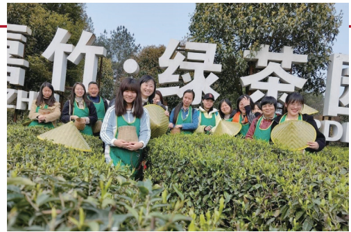
「三八」婦女節主題活動——採摘明前茶