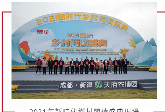
2021年新時代鄉村閱讀盛典現場

2021年，本集團着力推進實體書店建設，持續完善垂直縱深閱讀服務網絡體系，以「店內+店外」「線上+線下」的業務布局創新實體書店經營模式，拓展營銷渠道，推出更多元、更精良、更豐富、更深刻的閱讀產品和服務，推動實體書店業務穩步發展。2021年，本集團實體書店零售圖書實現銷售收入人民幣7.16億元，同比增長21.04%，恢復速度高於全國行業平均水平。在店內業務方面，通過圖書供應鏈優化、品類矩陣調整、賣場轉型、營銷升級等措施，穩定了店內銷售基本盤；實施不同業務模式的門店擴張經營，降低開店成本，優化了網點布局，完成了雅安書城、金堂店等遷址改造和升級煥新，品牌形象進一步提升。在店外業務方面，大力開拓政企業務，以建黨100周年為契機，全力做好主題時政類出版物的徵訂發行服務保障工作，同時以專業服務能力為政企客戶提供閱讀服務的定製解決方案；深化「館店融合」，推動實體門店與全省公共圖書館融合發展，不斷延展雙方服務範圍，館配業務取得了較快發展。在線上營銷方面，積極拓展直播帶貨、社群營銷等營銷方式，實現社群資源有效轉化和門店相互導流。