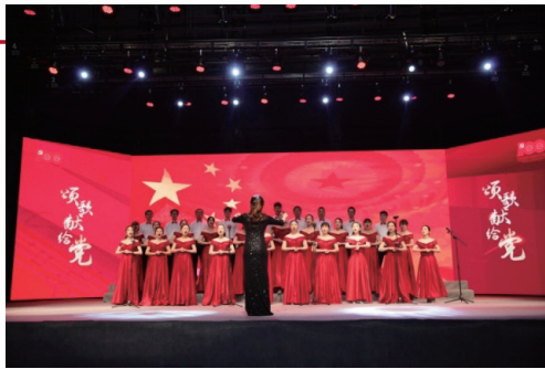
「頌歌獻給黨」歌詠比賽

本集團關心員工的工作與生活，重視人文關愛，積極主動的為員工解決實際困難，開展送溫暖活動，切實關心職工生活。建立了困難職工檔案，向困難職工提供政策援助和資金扶持；對生病住院職工、生育女職工、退休職工進行探望，提升員工幸福感和歸屬感。同時，本集團組織豐富多彩的員工文體活動，給員工展現不同才能的機會。2021年度，開展了員工體育運動會、三八婦女節主題活動、歌詠比賽、夜跑、夜讀等活動，促進員工身心健康。