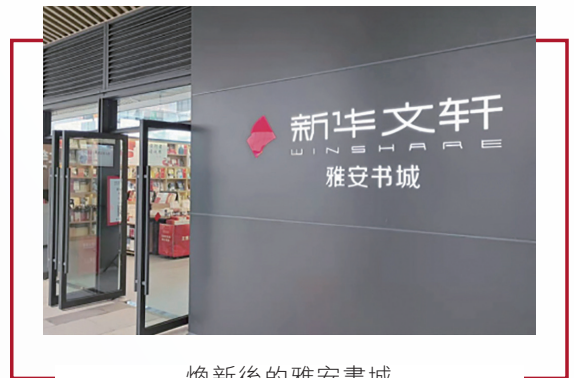
煥新後的雅安書城