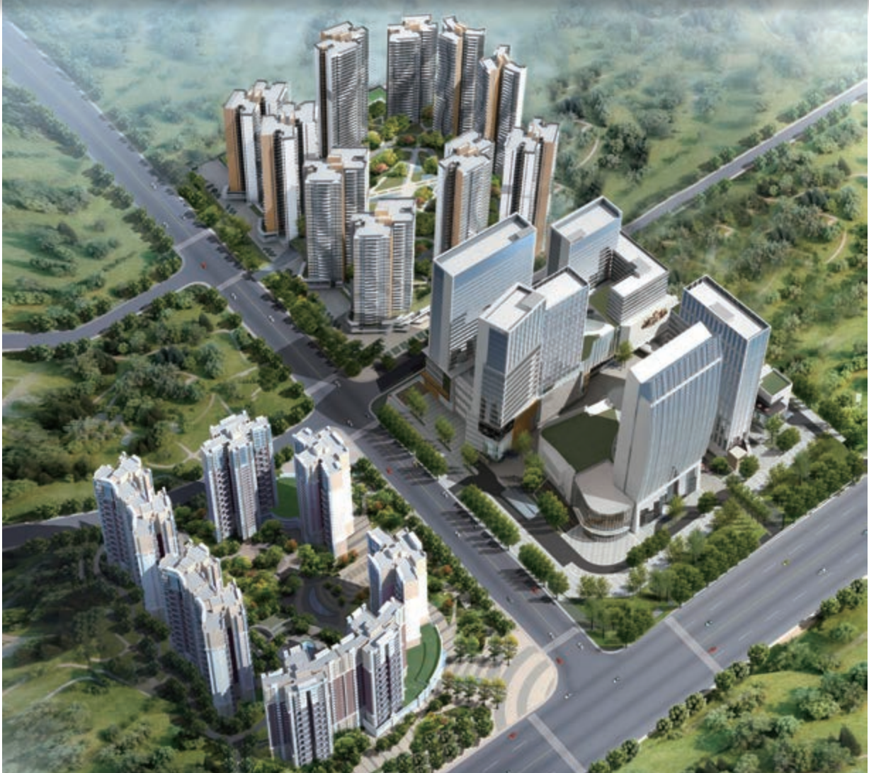
富豪國際新都薈 — 位於四川成都新都區之酒店/商業/寫字樓/住宅綜合發展項目(*)