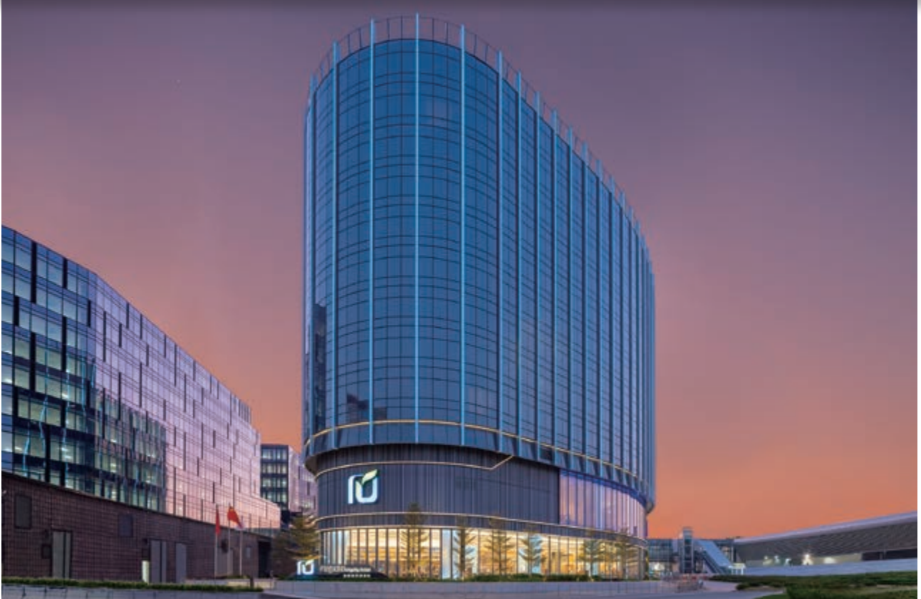
麗豪航天城酒店 — 位於香港國際機場赤鱗角地段第3號