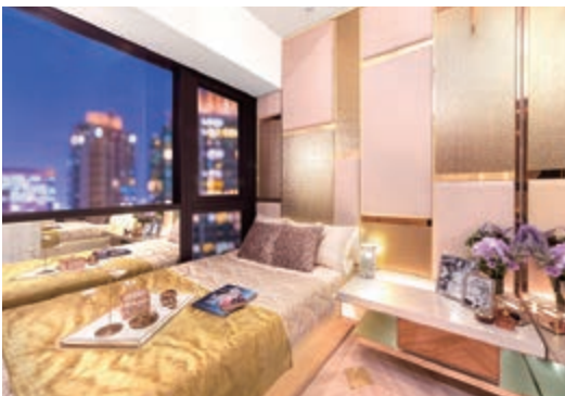
示範單位之主人房