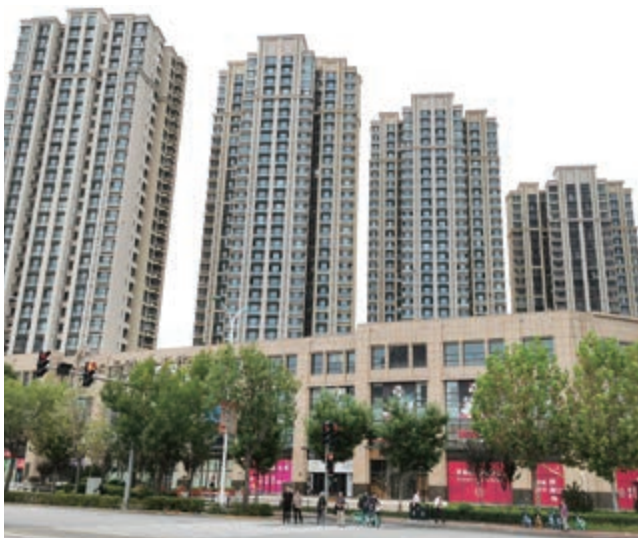
富豪新開門之住宅大樓及商業綜合大樓 — 已落成