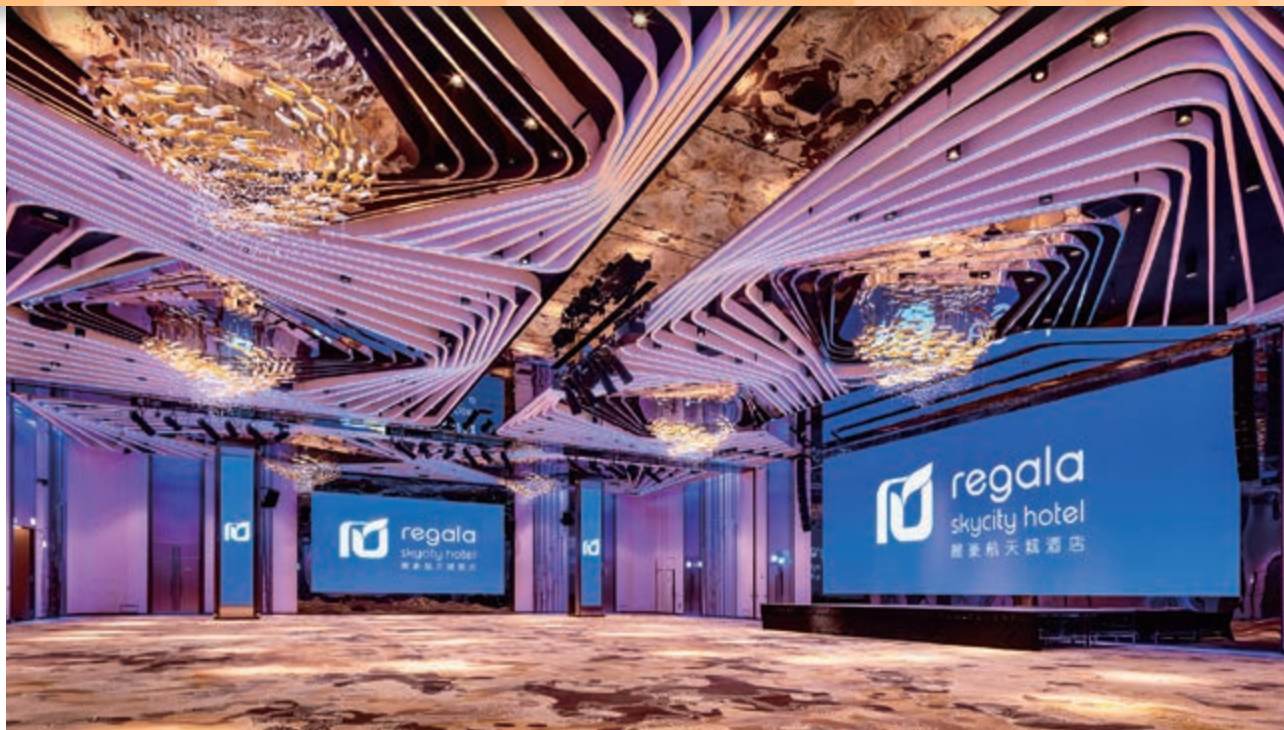
宴會廳 — Palladium