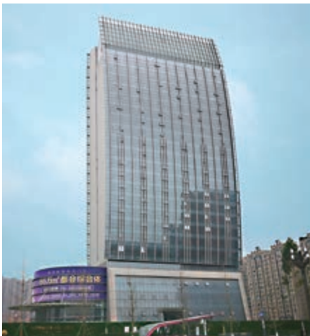
富豪國際新都薈之酒店發展項目 富豪新都酒店