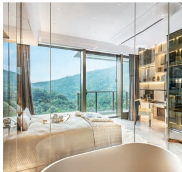
花園洋房之主人房