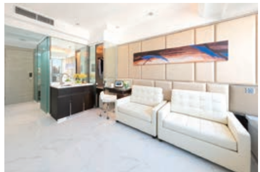
iResidence Elite 兩房套間