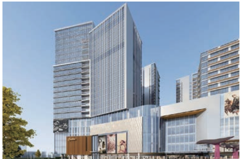
富豪國際新都薈之商業/寫字樓大樓(*)