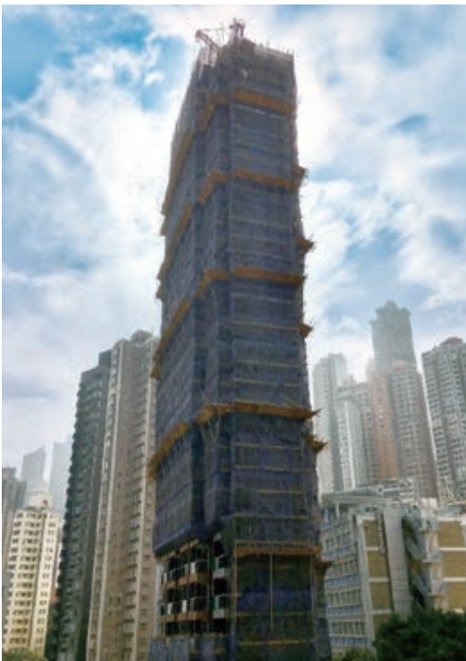
上蓋建築工程現正進行中