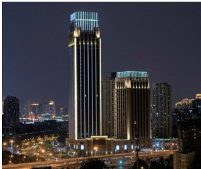
富豪新開門之寫字樓大樓 — 上蓋建築工程已竣工