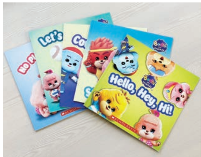
Scholastic Sing Along 圖書系列