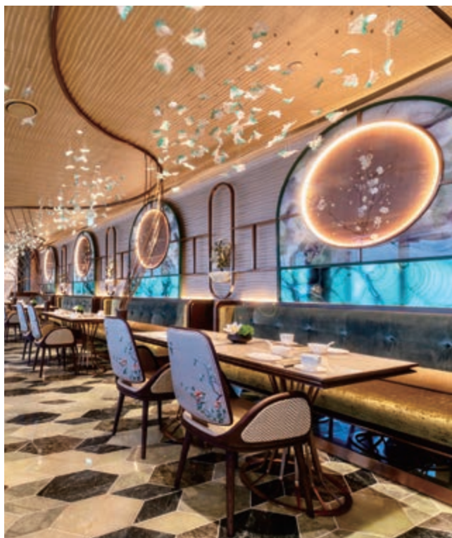
中餐廳 — the Jade