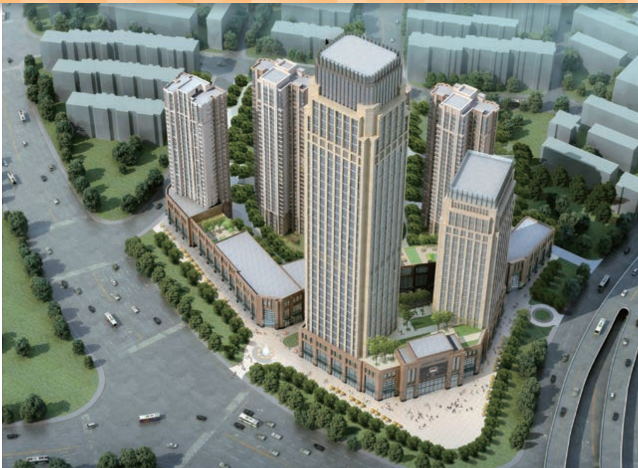
富豪新開門 — 位於天津河東區黃金地段之商業/寫字樓/住宅綜合發展項目(*)