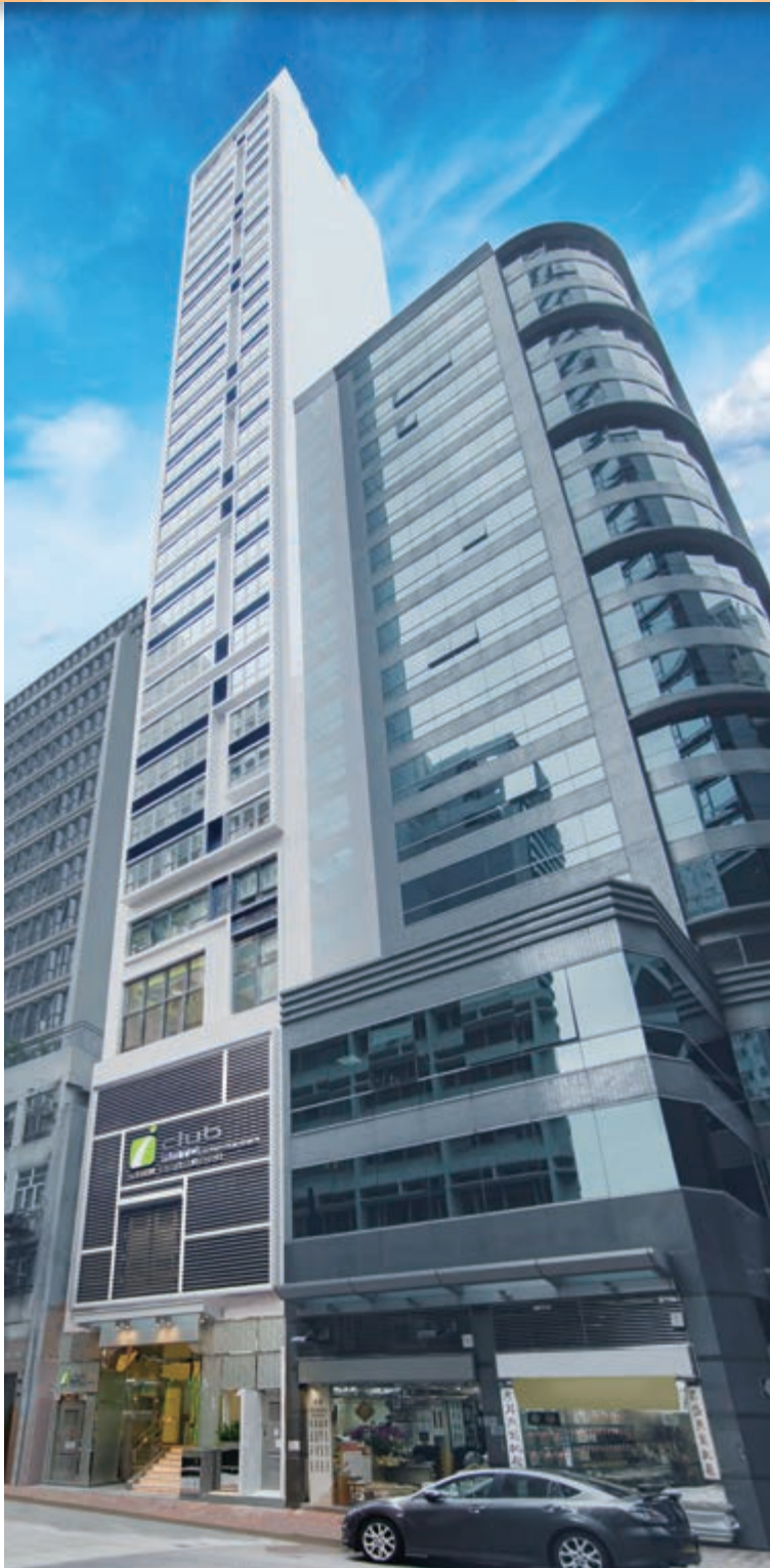
富薈尚乘上環酒店 — 位於香港上環文咸西街5號