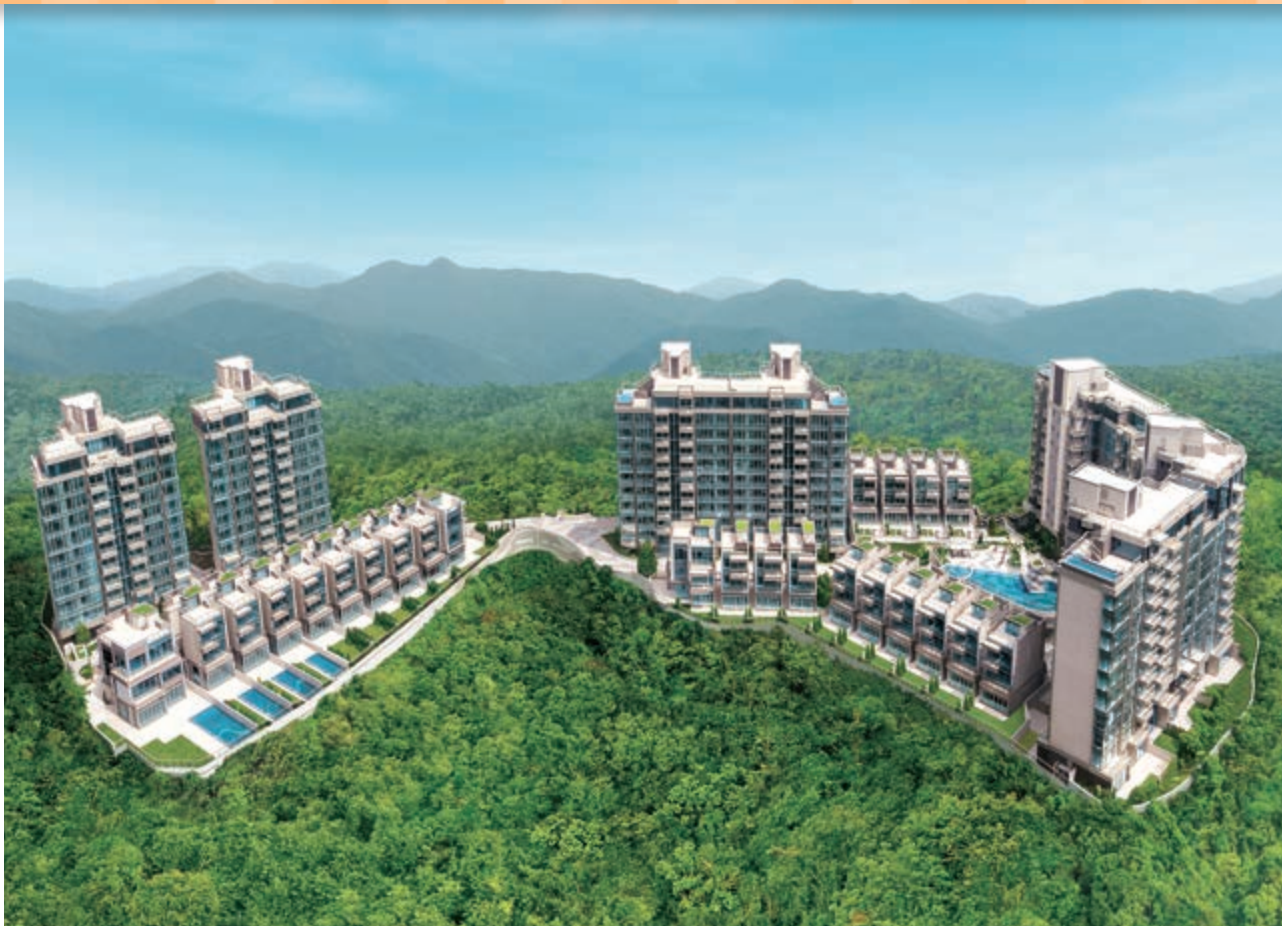
富豪 • 山峯 — 位於新界沙田九肚麗坪路23號之豪華住宅發展項目