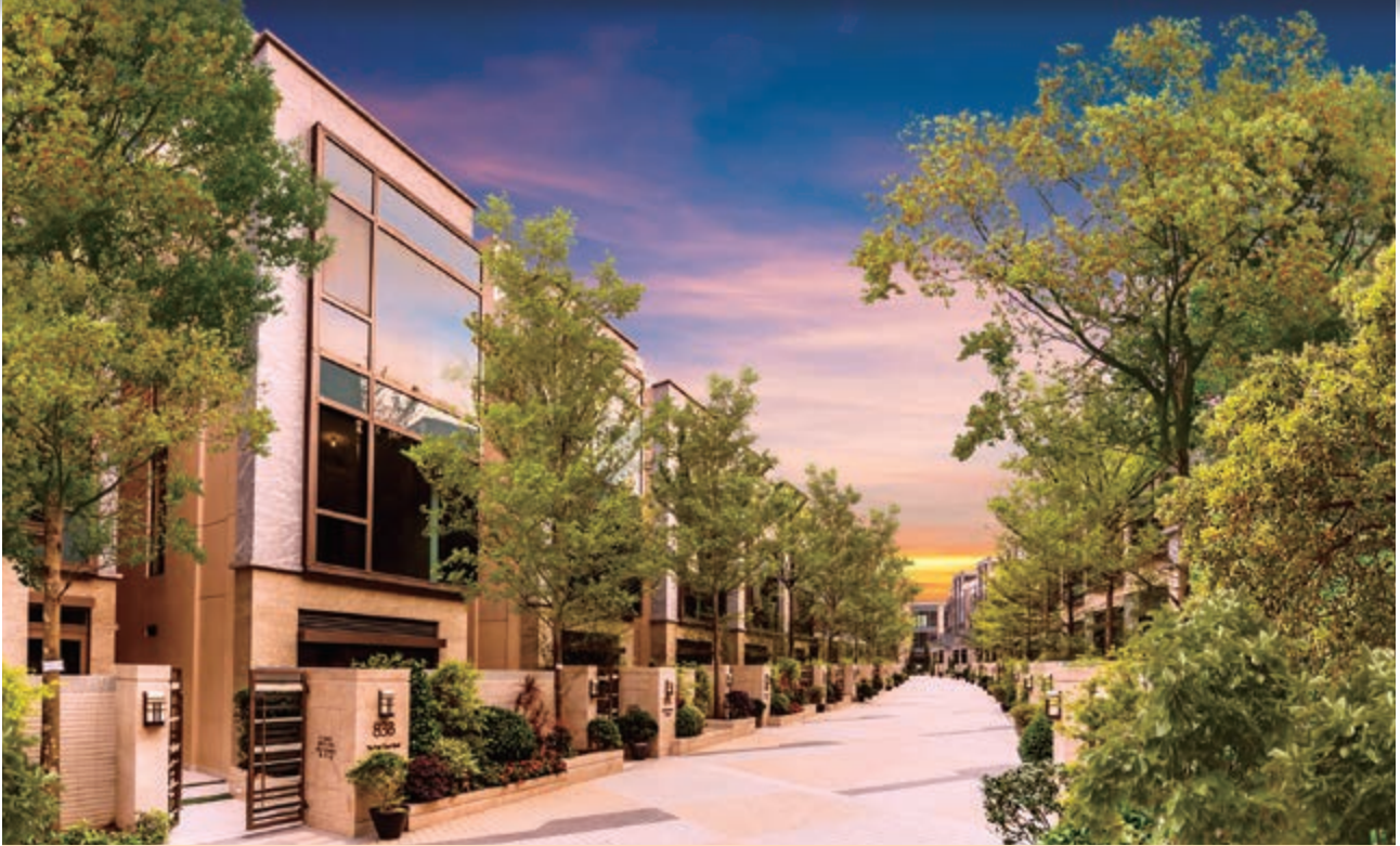
富豪 • 悅庭 — 位於新界元朗丹桂村路 65 至 89 號之住宅發展項目之花園洋房