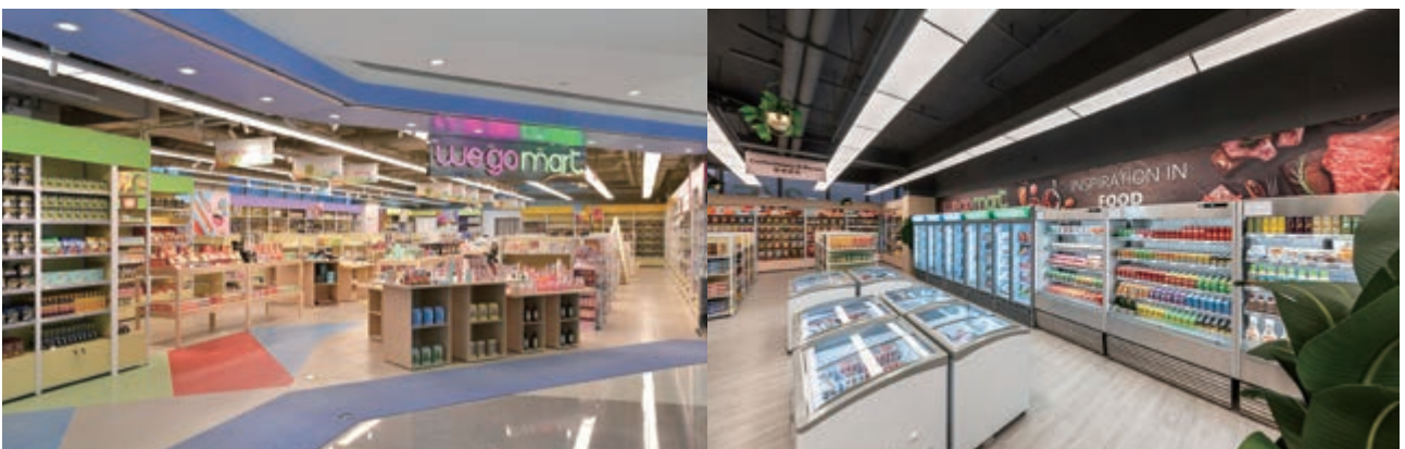
We Go Mart