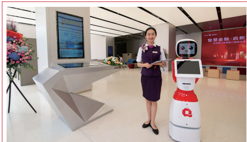
本行積極推廣智慧廳堂項目建設。

拓寬零售服務領域，下沉金融服務到農村。通過強化科技賦能、深化產品創新、優化金融服務、細化風控等措施，深度融入鄉村振興戰略，本行佈局全省、深耕山東的惠農金融戰略已初具雛形。報告期末，本行助農金融綜合服務站已簽約2,705家，較上年末新增簽約1,537家，增幅131.59%，其中已正式達標開業508家；惠農客戶15.79萬戶，較上年末增加9.46萬戶，增幅149.72%。