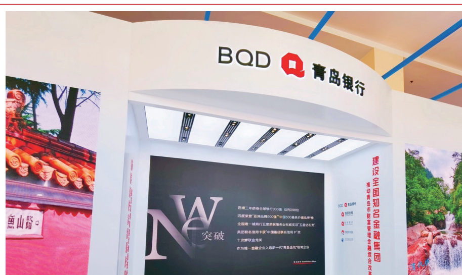
2021年5月，本行在上海展覽中心亮相第五屆中國品牌日活動。