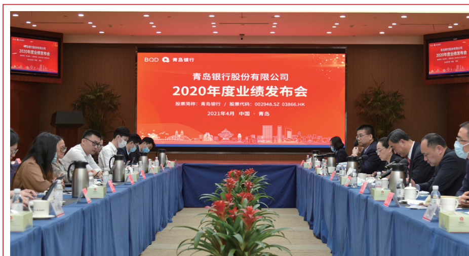
2021年4月，本行召開2020年度業績發佈會，與分析師、投資人及專業媒體進行深入的互動交流。