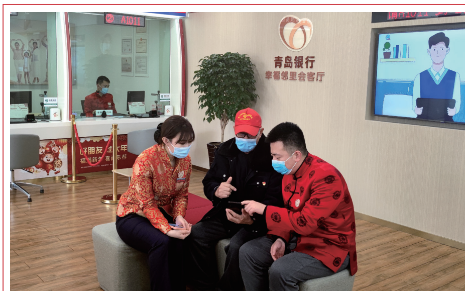
本行加快社區金融佈局，以「幸福鄰里」品牌為引領，積極推進社區金融網點建設。

依託互聯網發展消費貸款。報告期末線上消費貸款餘額100.48億元，較上年末增長61.54億元，增幅158.04%，報告期內累計發放線上消費貸款229萬筆，放款金額194.88億元。報告期內，本行推出自營個人互聯網信用貸款產品「海融易貸」，該產品的業務受理、風險評估、貸款發放等核心業務環節均由本行自主設計研發。