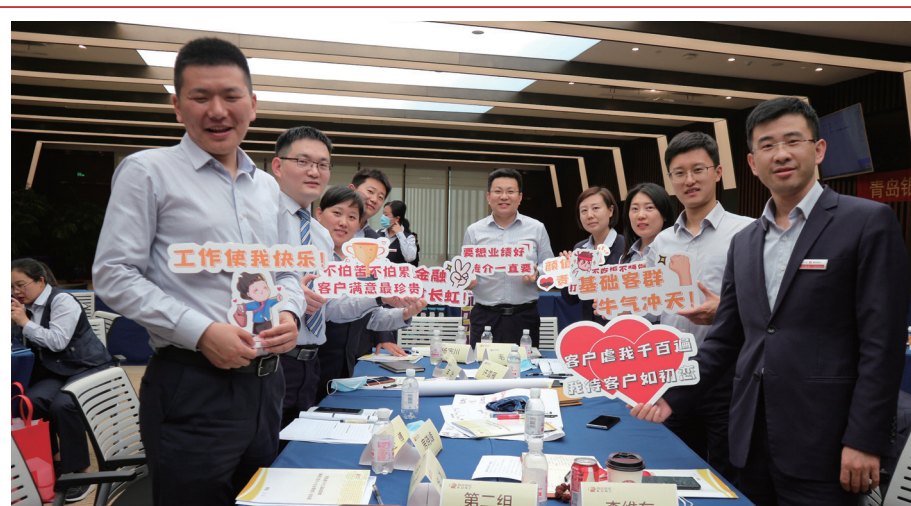
2021年5月，本行舉辦對公客戶群體專題培訓，提升客戶經理營銷能力。

註1：普惠型小微貸款，包括單戶授信少於等於1,000萬元的小型 and 微型企業貸款、個體工商戶貸款及小微企業主貸款，不含貼現。