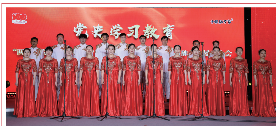
2021年6月25日，本行召開慶祝中國共產黨成立100周年活動，圖為現場合唱《沒有共產黨就沒有新中國》。

2021年，本公司理財手續費收入12.65億元，比上年增加2.56億元，增長25.39%，主要是理財產品規模擴大，固定管理費收入增加，並在嚴控風險的前提下，提升交易獲利能力，浮動管理費收入較快增長；委託及代理業務手續費收入5.07億元，比上年增加0.52億元，增長11.52%，主要是代理保險、基金等手續費收入增長；託管及銀行卡手續費收入2.28億元，比上年增加0.58億元，增長34.02%，主要是信用卡手續費收入增加；融資租賃手續費收入0.87億元，比上年減少0.72億元，下降45.22%，主要是新增租賃業務及收費減少；結算業務手續費收入0.65億元，比上年增加0.30億元，增長82.80%，主要是信用證開證手續費收入增加。