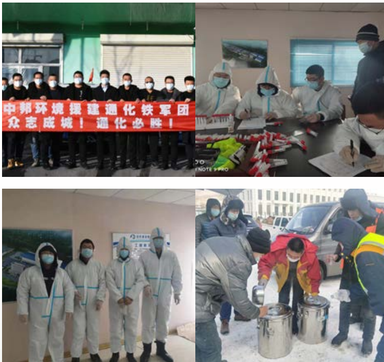
支援通化方艙醫院建設