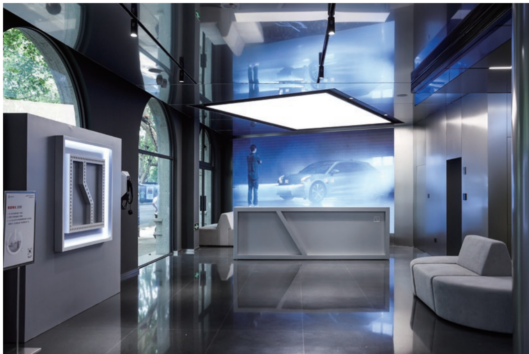
● 由常宏施工的全國首家極氫中心在杭州西湖景區開業

本集團的室內設計及裝修業務以「石家莊常宏建築裝飾工程有限公司」（或稱「常宏」）經營；服裝出口業務主要以「力佳實業有限公司」及「永佳設計中心有限公司」經營；本集團以「Jeanswest」品牌經營的服裝業務網絡分佈在香港，並以海外加盟模式於東南亞和中東地區經營「Jeanswest」的加盟業務。