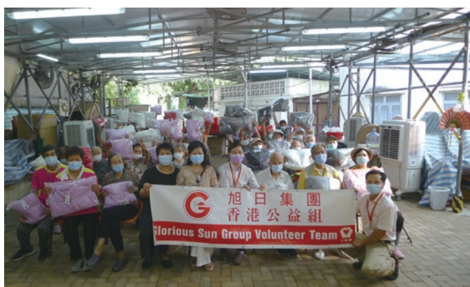
● 本集團公益組向長者送羽絨棉襖