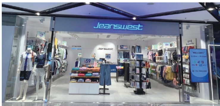
● Jeanswest 致力為顧客提供物超所值的服裝產品

於2021年，Jeanswest處理了10宗客戶投訴個案，全部因涉及布料質量問題，當中沒有牽涉產品的安全與健康理由而需要回收。