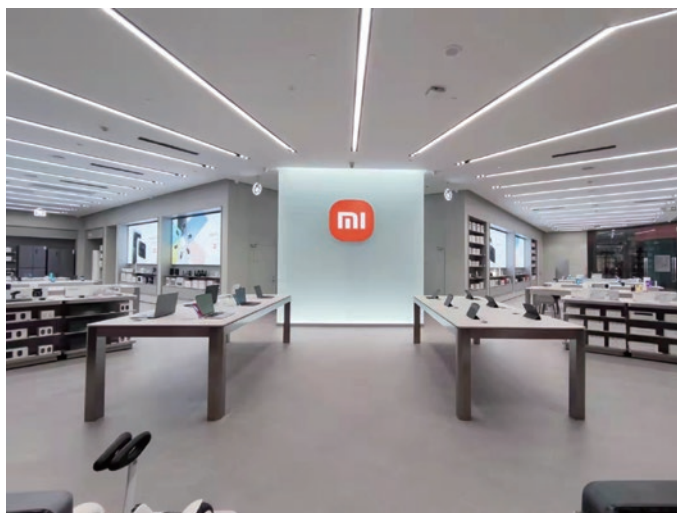
● 常宏為小米第10,001家專門店提供道具產品及裝修服務