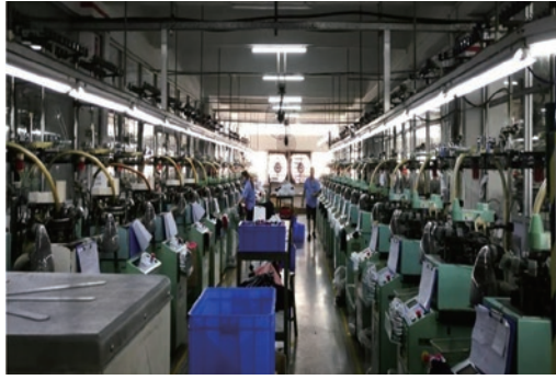
● 本集團向供應商推行社會責任評核工廠制度