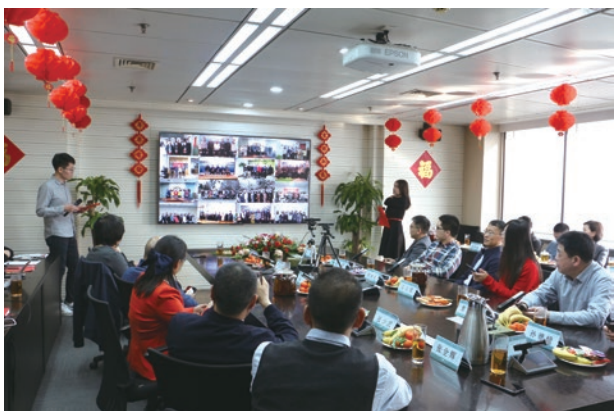
● 常宏舉辦新春線上聯歡會

員工福利： 依法購買勞工保險或社會保險、住房公積金（中國內地適用）；除社會保險外，本集團亦為所需要的員工購買人身意外保險，保障員工的人身安全。本集團各地區辦公室均嚴格執行香港、中國內地的相關法律法規，員工可享有薪假期福利，包括法定假期、年假、病假、婚假、產假／生育假期、侍產假（適用於香港）、看護假（適用於中國內地）、喪假、工傷假等。