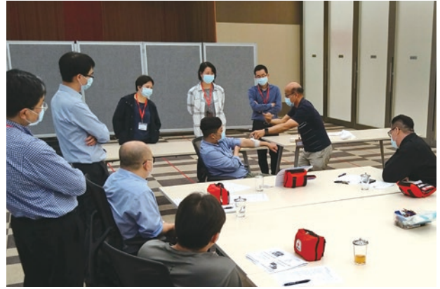
● 香港總部舉辦「遠足急救工作坊」，讓員工學習基本急救知識和技術