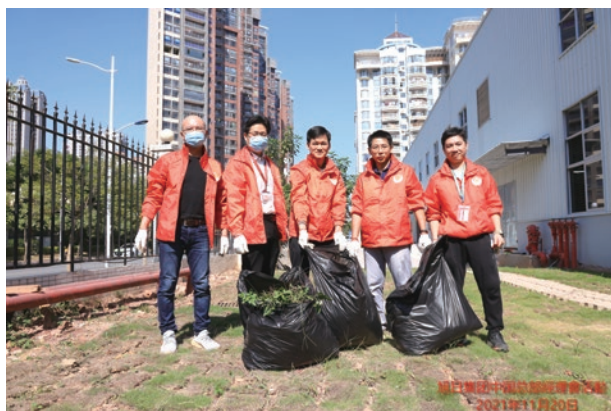
● 舉辦「清潔旭日家園」活動，增加員工對本集團的歸屬感