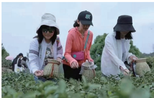
● 經理會戶外拓展活動，認識中國傳統文化「茶道」