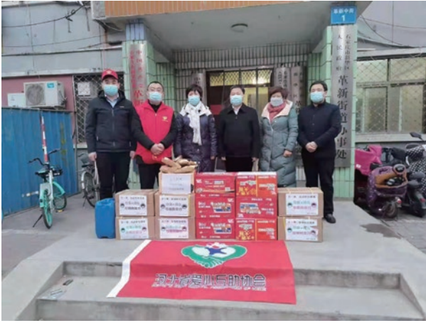
● 常宏向抗疫一線工作人員捐贈物資