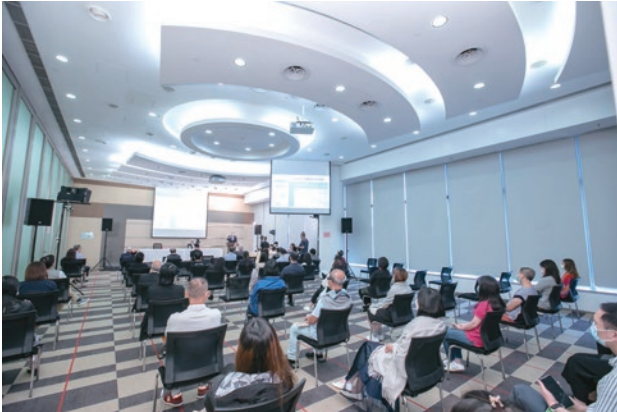
● 香港總部舉行「新冠疫苗醫學講座」

2021年，世界各地繼續加強控制新冠肺炎疫情，為恢復各種經濟活動，各地政府鼓勵市民接種新冠疫苗。本集團亦響應政府的呼籲，為香港總部和中國總部的員工推出一系列鼓勵接種疫苗措施。在中國總部，向員工宣傳新冠疫苗的作用，並組織員工到醫院接種新冠疫苗；在香港總部，安排員工進行空腹抽血檢查及向醫生諮詢是否適合接種疫苗，以及舉行「新冠疫苗醫學講座」。本集團亦十分關心常宏員工在河北的健康，向員工發送抗疫前線應用的藥品，助員工預防新冠肺炎；員工每日健康打卡，全方位做好疫情防控和應對工作。