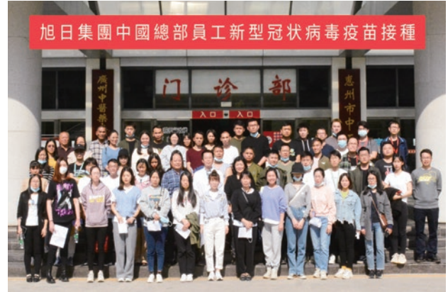
● 中國總部組織員工到醫院接種新冠疫苗

本集團每年均舉辦防火演習及簡介會，令員工熟悉火警逃生路線及掌握最新知識。另外，本集團於2021年舉辦了多個不同主題的健康推廣活動，包括在中國總部進行每年一次的員工健康體檢、特別為女員工而設的乳腺檢查，並舉辦關於抑鬱症的心理健康講座，讓員工進一步了解生理和精神上的健康狀況；此外，在香港總部舉辦了「遠足急救工作坊」，讓員工學習基本急救知識和技術。