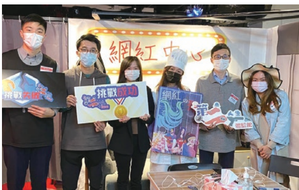
● 行政主任周年聚會參與了「Live action role-playing game」劇本殺第二人生體驗活動