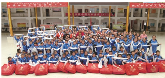
● 本集團公益組於四川甘孜州舉行冬賑慰問

本集團連續多年均獲香港社會福利署旗下的推廣義工服務督導委員會頒授「義務工作嘉許狀」，及連續11年獲香港社會服務聯會嘉許為「商界展關懷Caring Company」。