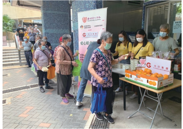
● 本集團公益組向因疫情影響的長者和有需要人士派贈飯盒