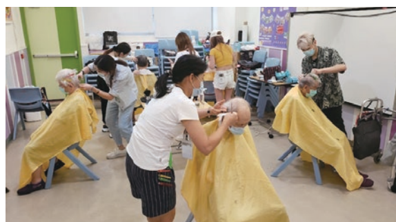
● 本集團公益組與YMCA合作，為長者義務理髮