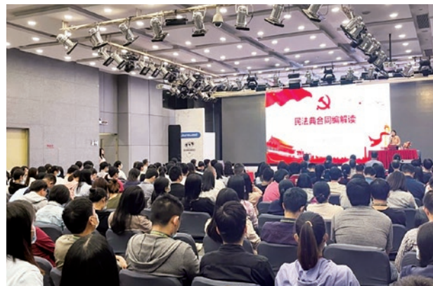
● 律師為員工講解《中華人民共和國民法典》合同編