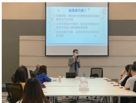
● 本集團香港總部舉辦「ICAC防貪誠信講座」