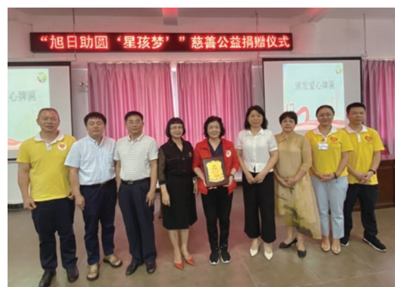
● 本集團支持內地自閉兒童困難家庭