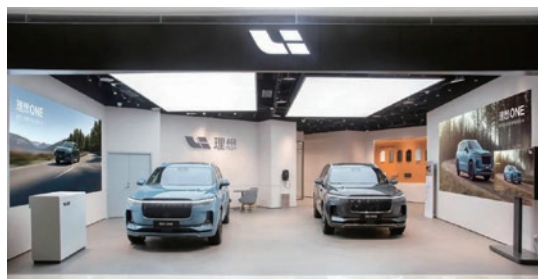
● 常宏為新能源汽車理想汽車提供建店服務