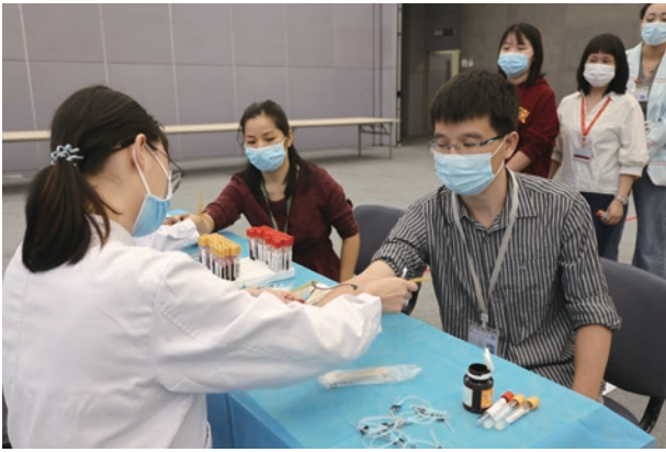
● 中國總部進行年度員工健康體檢