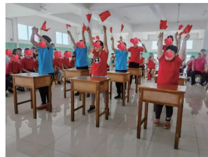
兒童節愛心傳遞活動