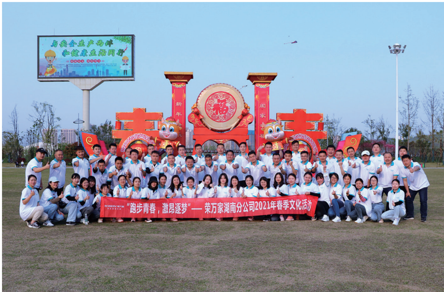
「跑步青春，激昂逐夢」文化活動

本集團積極開展和組織員工活動，舉辦了包括傳統節日慶典、團隊建設、企業文化建設、福利關懷等多方面的員工活動，豐富員工的業餘生活。