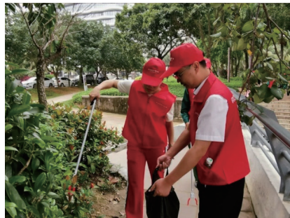
撿拾垃圾公益活動