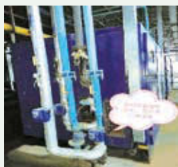
空壓機餘熱回收機組

報告期內，巨寶廠區和內江廠區均利用空壓機餘熱回收機組加熱生活用水，減少電力能源消耗。其中巨寶廠區餘熱回收74,589萬kcal，替代天然氣45.56萬立方米，替代標煤553噸標煤；內江廠區全年節省天然氣300,000立方米，減少369噸標煤。