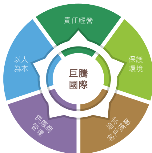
巨騰國際使命願景

巨騰國際始終以質量優先、科學管理及可持續發展為根本。過去的21年，各國政府和市場對電子行業產業鏈的要求愈發嚴格，我們依靠自身先進的技術、負責任的態度、專業的服務以及優良的產品品質贏得了全球客戶的認可。我們深知，好的企業不只表現在其產品本身，同時還體現在企業的管理水平和可持續發展能力上。我們本著為社會負責、推動上游企業共同進步、維護廣大投資者利益的目標，通過以下五個方面的深耕，致力於電子行業的可持續發展。