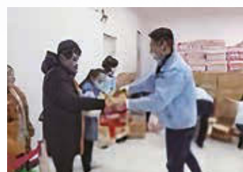
2021年底物資米和麵的發放

未來，巨騰國際將持續關注社區發展，未來進一步擴大社區投資，注重本集團與所在地的共同發展。