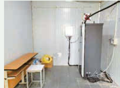
廢氣排放監測站房