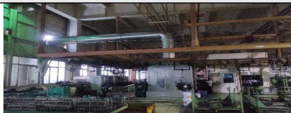
整改後的噴漆房及廢氣管道

為減少在變速箱製造過程中所產生的有機廢氣，本集團開展實施了本項目以對變速箱裝配線噴漆房進行升級改造，針對噴漆、補漆所產生的有機廢氣進行了兩處治理。由原先的無組織排放轉變為現在的有組織排放，不僅消除了噴漆廢氣和補漆廢氣帶來的環境隱患，同時有利於保障噴漆、補漆作業人員的職業健康，為本集團創造了較大的環保、職業健康效益。