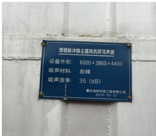
圖二 物理隔聲措施 - 吸聲房