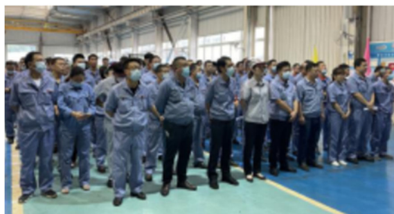
技能競賽開幕式場景

本集團十分重視對員工工匠精神及職工技能的培養，工會於 9 月中下旬，舉辦了「技能成就夢想·爭當時代工匠」職工技能大賽。期間，對各類工種的理論和實操技能進行考核，共計有 20 個單位、部門近 150 名員工參與。此次技能競賽進一步激發了員工學技術、創一流的熱情，達到了「以賽促學、以賽促練、以賽促用」的目的，為企業培養技術技能型人才奠定了堅實的基礎。