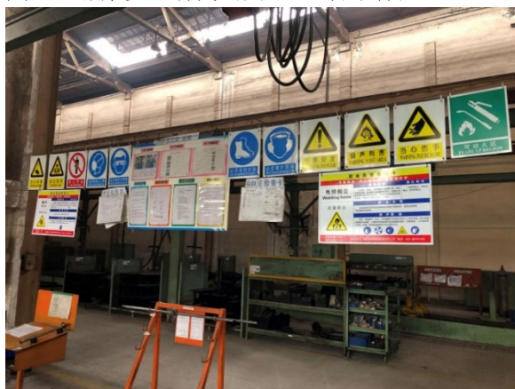
圖三 職業安全有關的用品 - 警示標誌