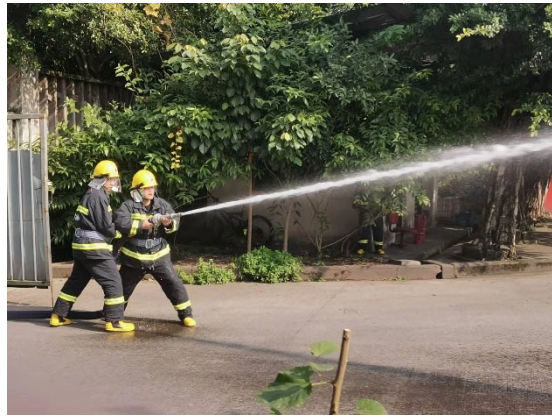
圖六 利用滅火器撲救初起火災