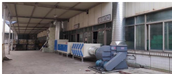
噴漆廢氣治理設施