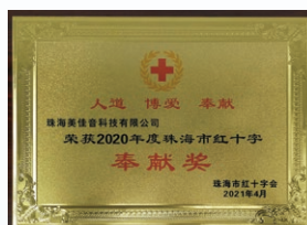
2021年4月，珠海美佳音獲珠海市紅十字會授予「奉獻獎」。