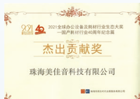
2021年，珠海美佳音於「2021全球辦公設備及耗材行業生態大獎」活動榮獲「傑出貢獻獎」。