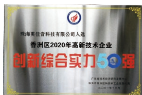
2021年12月，珠海美佳音榮獲「香洲區2020年度高新技術企業創新綜合實力50強」稱號。