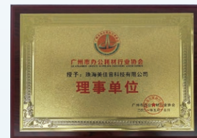
2021年5月，珠海美佳音被廣州市辦公耗材行業協會評為「廣州市辦公耗材行業協會理事單位」。