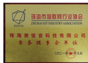
2021年11月，珠海美佳音被珠海市物聯網行業協會評為「珠海市物聯網行業協會常務理事會單位」。