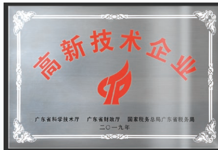
2019年，珠海美佳音獲確認為「高新科技企業」，為期三年。