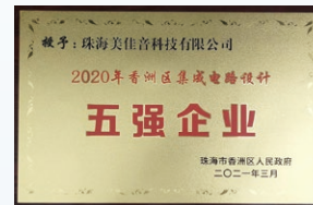
2021年3月，珠海美佳音被珠海市香洲區人民政府評為「香洲區集成電路設計五強企業」。