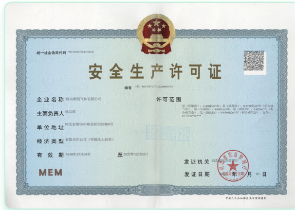
唐鋼氣體已取得《安全生產許可證》，許可生產壓縮及液化氣體，如氧、氮、氬及氫氣，有效期由2020年12月3日至2023年12月2日

本集團嚴格遵守《中華人民共和國產品質量法(2018修正)》，為其生產的產品質量負責。根據《中華人民共和國藥品管理法實施條例(2019修訂)》，無證的藥品不得在中國生產。於頒發許可證前，政府相關部門會對藥品生產商的生產設施進行檢查，並確定設施內的衛生條件、質量保證體系、管理結構和設備是否達到所要求的標準。藥品生產許可證有效期為五年。