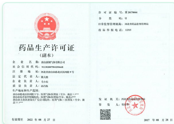
唐鋼氣體已取得《藥品生產許可證》，許可醫用氣體液態醫用氧氣，有效期由2017年8月28日至2022年8月27日

本集團嚴格遵守《中華人民共和國產品質量法(2018修正)》，為其生產的產品質量負責。根據《中華人民共和國藥品管理法實施條例(2019修訂)》，無證的藥品不得在中國生產。於頒發許可證前，政府相關部門會對藥品生產商的生產設施進行檢查，並確定設施內的衛生條件、質量保證體系、管理結構和設備是否達到所要求的標準。藥品生產許可證有效期為五年。