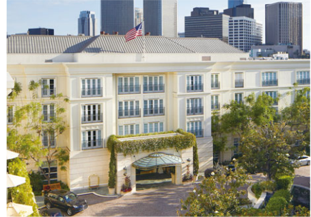
比華利山半島酒店