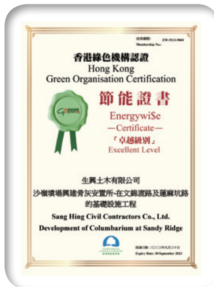
沙嶺墳場興建骨灰安置所榮獲節能證書「卓越級別」

本集團的努力得到了獎項及榮譽的認可。於報告期內，本集團的附屬公司之一生興土木有限公司就其項目之一沙嶺墳場興建骨灰安置所獲得節能證書「卓越級別」。