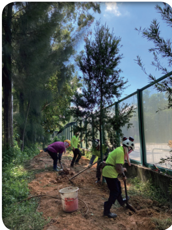
於我們的項目地點植樹