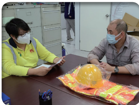
為僱員提供健康與安全培訓課程

新僱員須通過試用期（於特定職位的委任文件中確認）以熟悉公司文化及工作常規。試用期屆滿後，相關主管將根據其工作表現決定是否正式聘用該僱員。