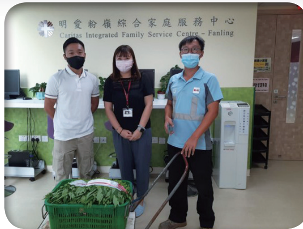
向明愛粉嶺綜合家庭服務中心捐贈農作物