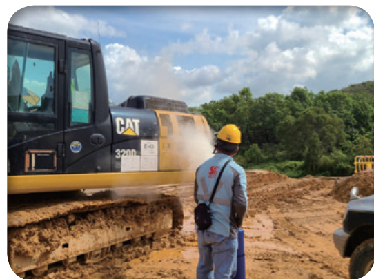
在項目地盤進行消防演習