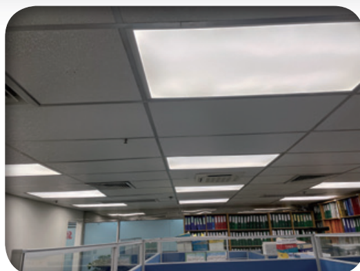
辦公室安裝節能燈具 (LED燈)