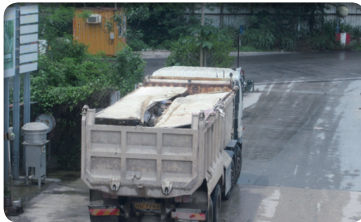
我們配備機械頂蓋的泥頭車