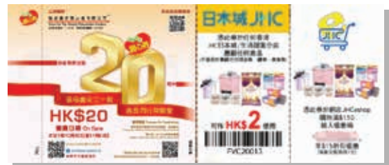
本集團贊助「愛心券」義賣活動。