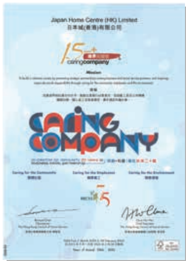
本集團榮獲香港社會服務聯會頒發「商界展關懷」獎項(連續15年或以上)。