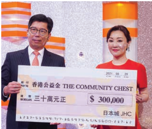
本集團捐助香港公益金$300,000