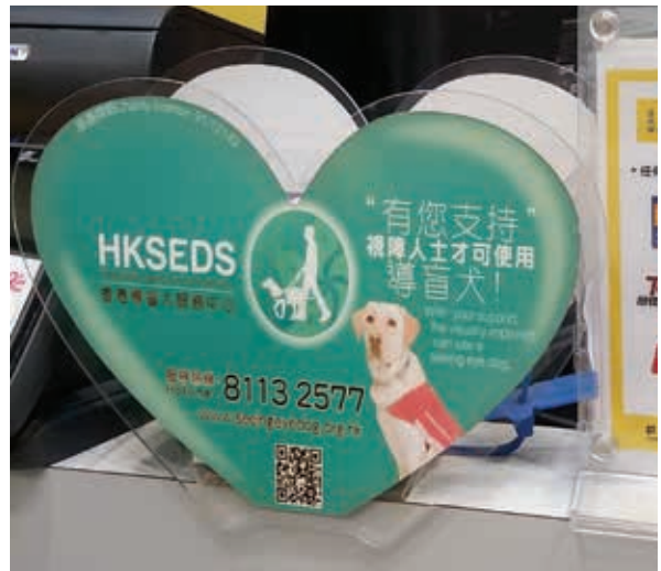
本集團於指定店舖擺放各非牟利團體捐款箱，非牟利團體包括香港導盲犬服務中心、基督教勵行會、奧比斯及國際小母牛香港分會等。