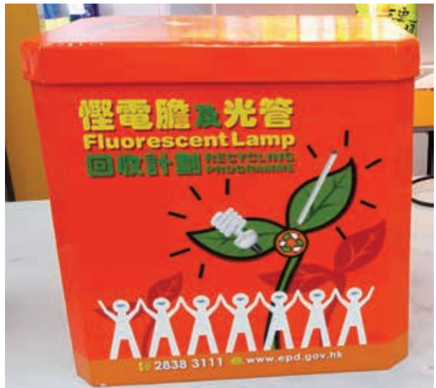
本集團參與環保署舉辦的「慳電膽及光管回收計劃」，於指定店舖放置回收箱。