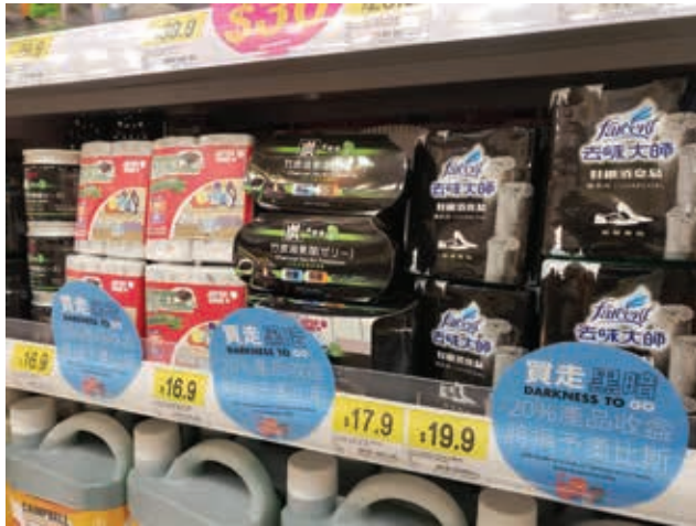
本集團參與由奧比斯主辦的奧比斯世界視覺日「買走黑暗」活動。