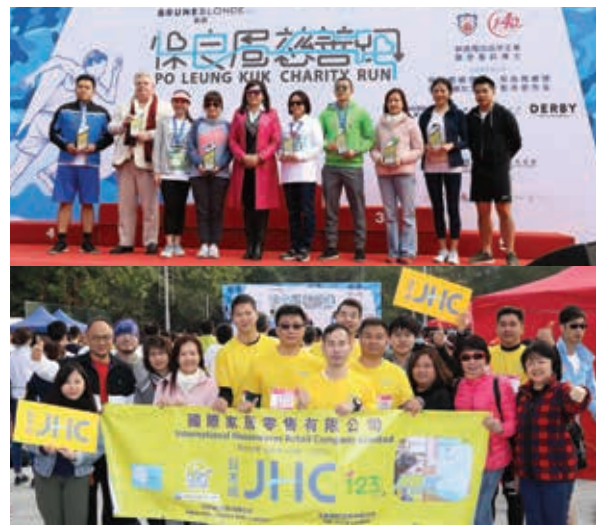
本集團贊助及參與保良局慈善跑。