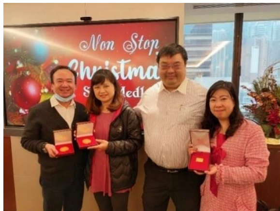
2021年的聖誕晚會及長期服務獎頒獎儀式