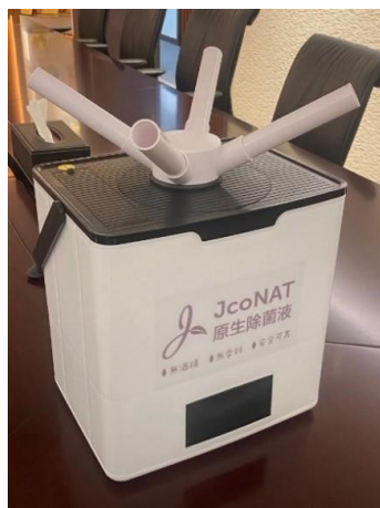
放置空氣淨化器在辦公場所內, 以改善空氣質素

在新型冠狀病毒疫症大流行期間，我們亦採取了應對措施，以確保我們的員工、客戶以及公眾安全。我們要求員工必須一直佩戴口罩及遵從交替工作安排，例如情況惡化時需縮短工作時間。而與確診病例有直接或間接接觸或與確診病例同住一棟大廈的員工，則必須在復工前獲得呈陰性的檢測結果。我們曾在2020年4月和2021年1月及當確診病例個案數字上升時為廣州辦公室的所有員工安排了新型冠狀病毒核酸檢測。