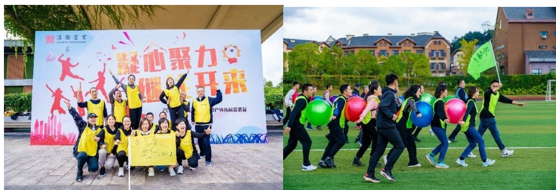
2021年10月的重慶戶外拓展訓練營