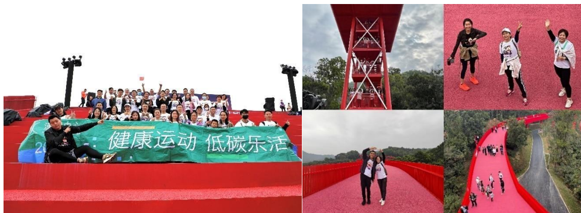
深圳公司舉辦健康戶外活動，以提升員工的文化生活和身體質素