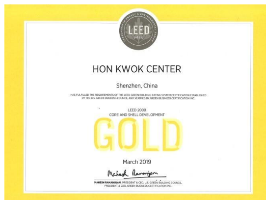
LEED 金級認證 - 深圳漢國中心

本集團重視其業務的可持續性，並致力將環保元素融入到營運中。為了促進綠色和可持續建築設計，以及良好的空氣和水質管理，我們對自身的物業進行綠色建築標準認證。我們的重慶漢國中心和重慶金山商業中心獲得了 WELL 健康評級，深圳漢國中心則獲得能源與環境先導設計（「LEED」）金級認證和 WELL 健康-安全評級（「WELL HSR」）。此外，我們在香港新成立的數據中心 HKG11 獲得了香港綠色建築議會有限公司的綠建環評認證。在未來，我們目標將增加獲得綠色建築認證的物業數量。