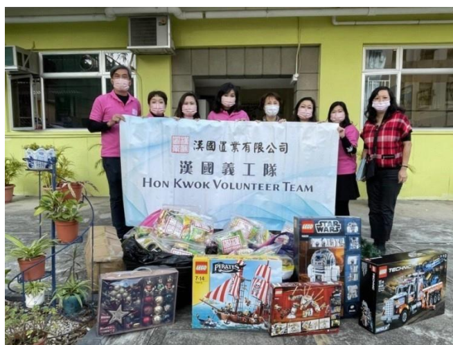
2021年12月，我們的義工團隊帶著糖果禮包、聖誕樹連裝飾以及玩具積木探訪中國基督教播道會 - 播道兒童之家，與孩子們慶祝聖誕節