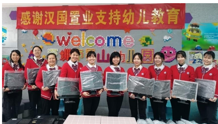
我們將一些閑置電腦捐贈給深圳景山幼稚園，為老師和學生們送上溫暖和支持