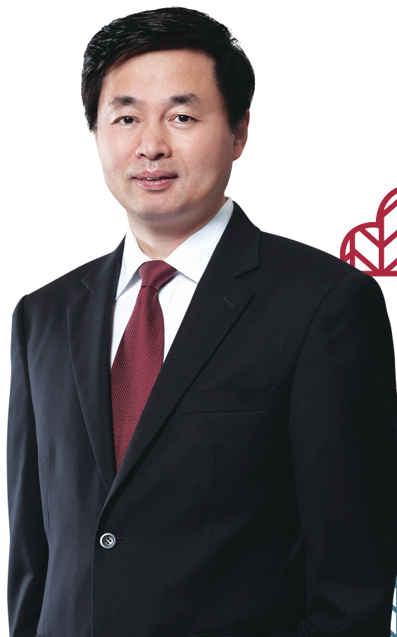
柯瑞文 董事長兼首席執行官