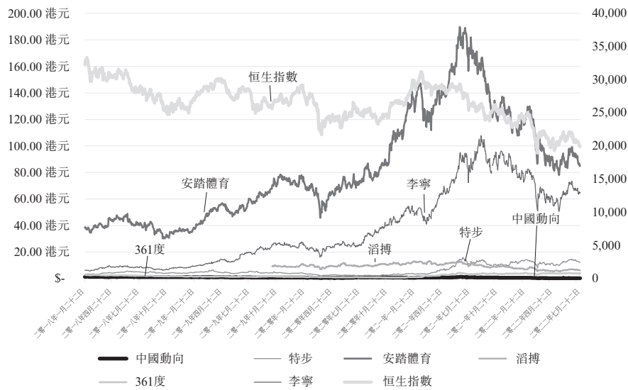
中國動向及其可資比較公司相對恒生指數之股價表現 (二零一八年至二零二二年財政年度)

貴公司的最近期股價反映押記股份的價值不足以完全覆蓋認購貸款各自的未償還本金。吾等亦已研究以下於聯交所主板上市的運動服裝行業可資比較公司(即特步、安踏體育、滔搏、361度及李寧)，以分析其於二零一八年財政年度至二零二二年財政年度的五個年度期間(為授出認購貸款的初始期間)的股價表現及恒生指數(「恒生指數」)(如下圖所示)。