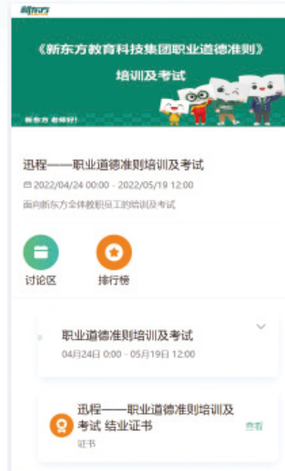
職業道德準則培訓及考試