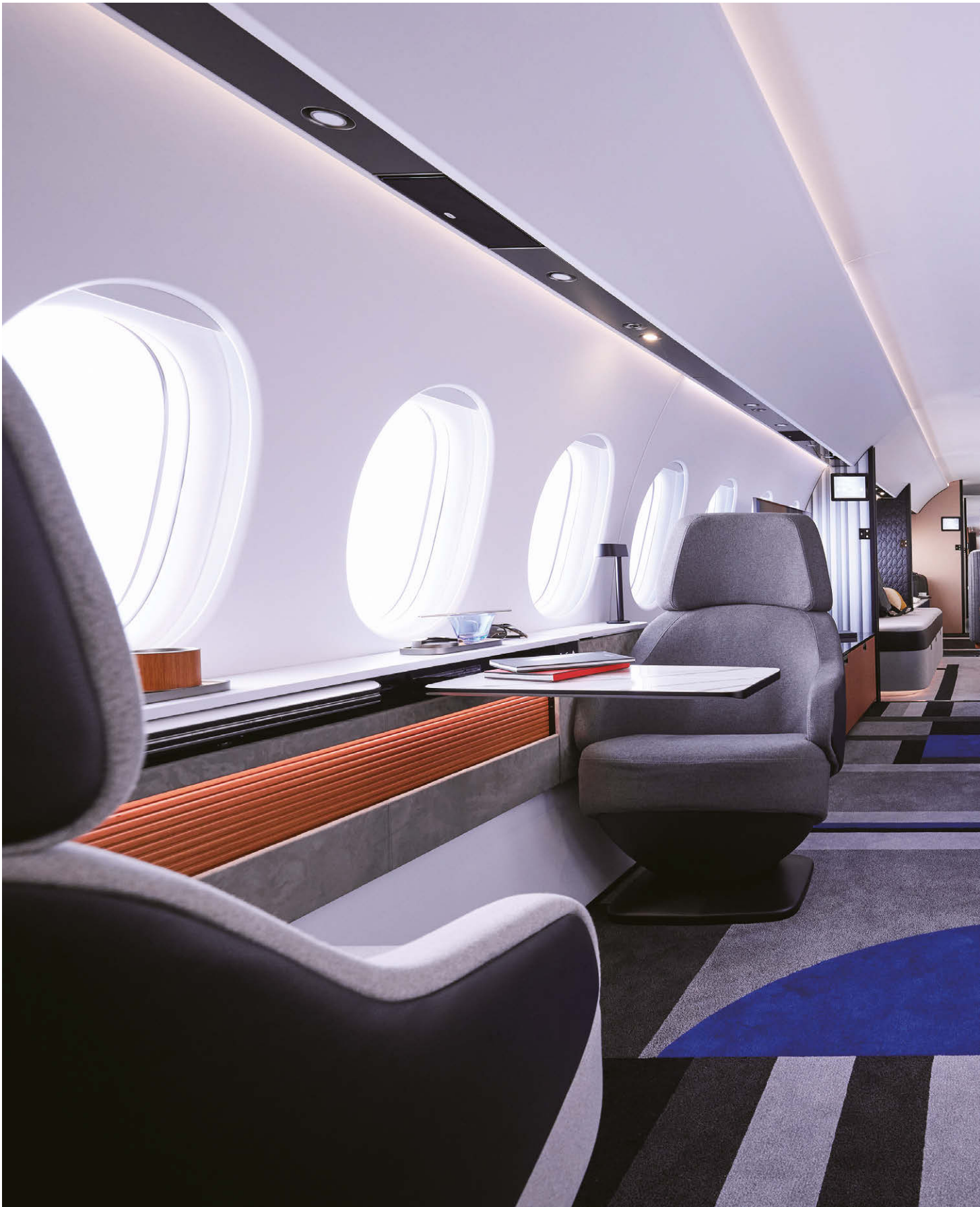
達索航空獵鷹10X私人飛機 以羊毛手工簇絨製成的定制太平地氈