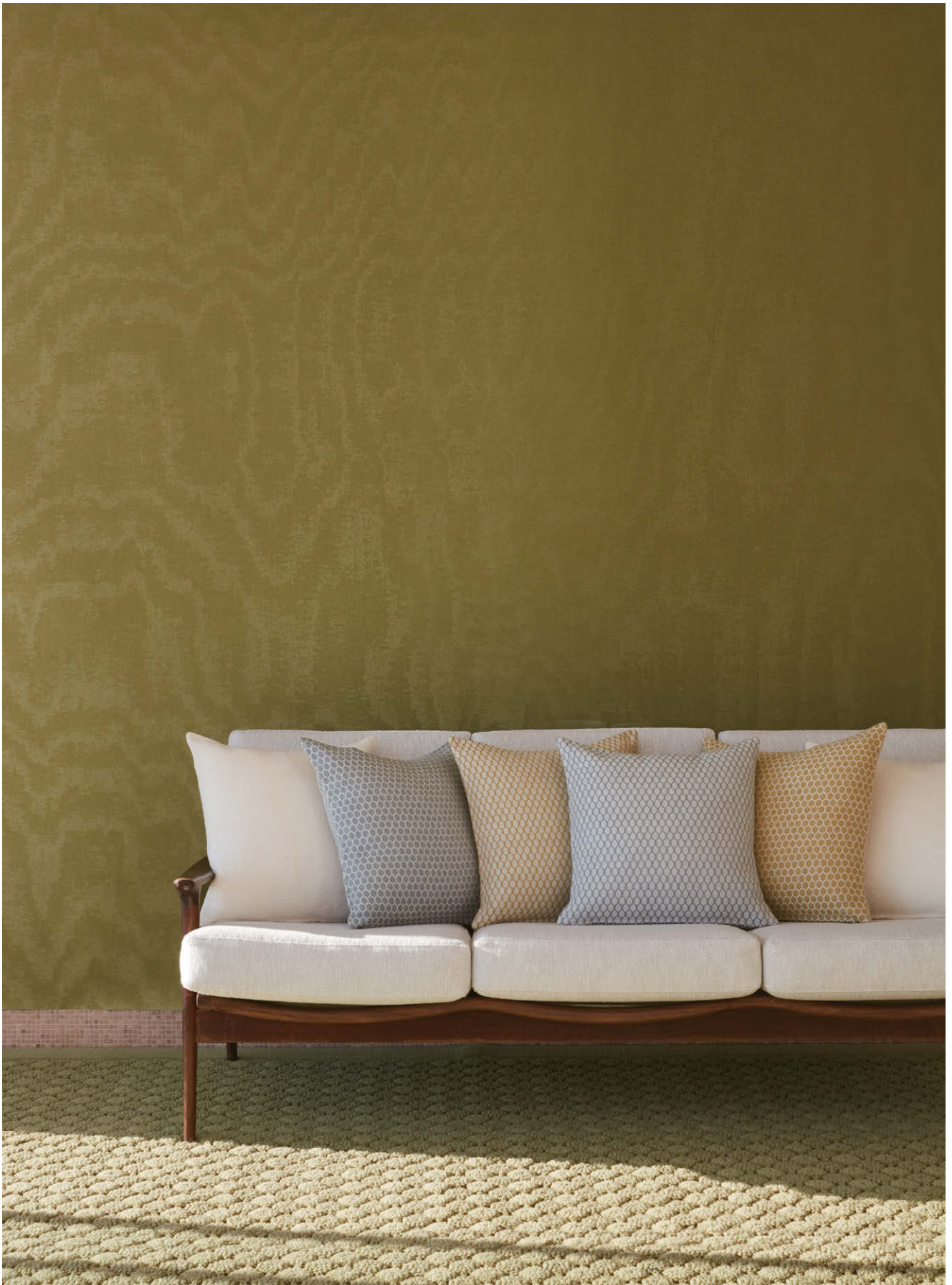
Bord de Mer · 來自La Manufacture Cogolin的面料系列及經典的Artuby地氈 Bord de Mer以亞麻製成，Artuby地氈以羊毛手工織造