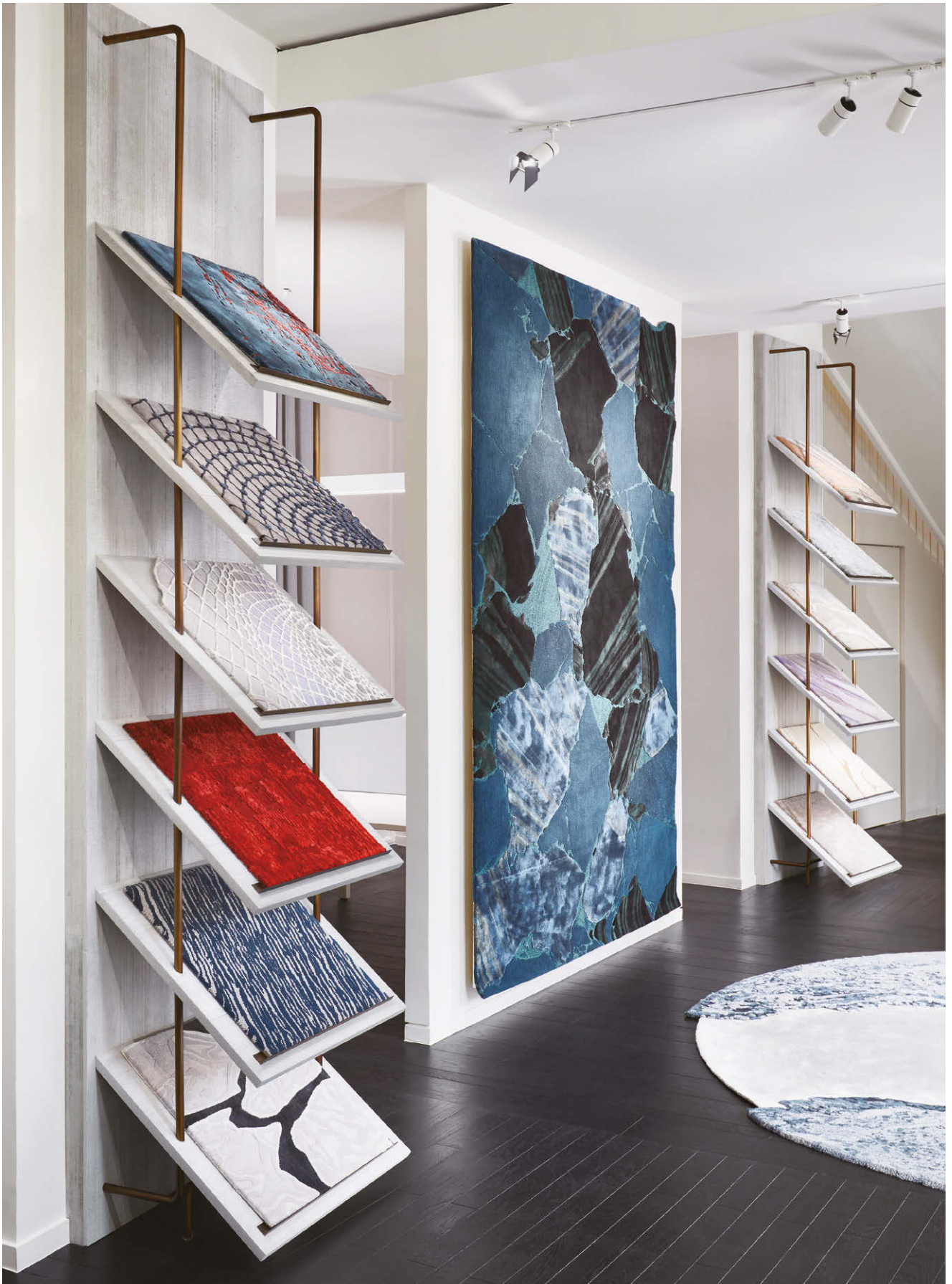
由Elliott Barnes設計，位於勝利廣場的巴黎陳列室 Lengfeld I ，來自Noé Duchaufour-Lawrance 為太平設計的Raw系列 以羊毛、Field、絲綢及幼金銀絲手工簇絨製成