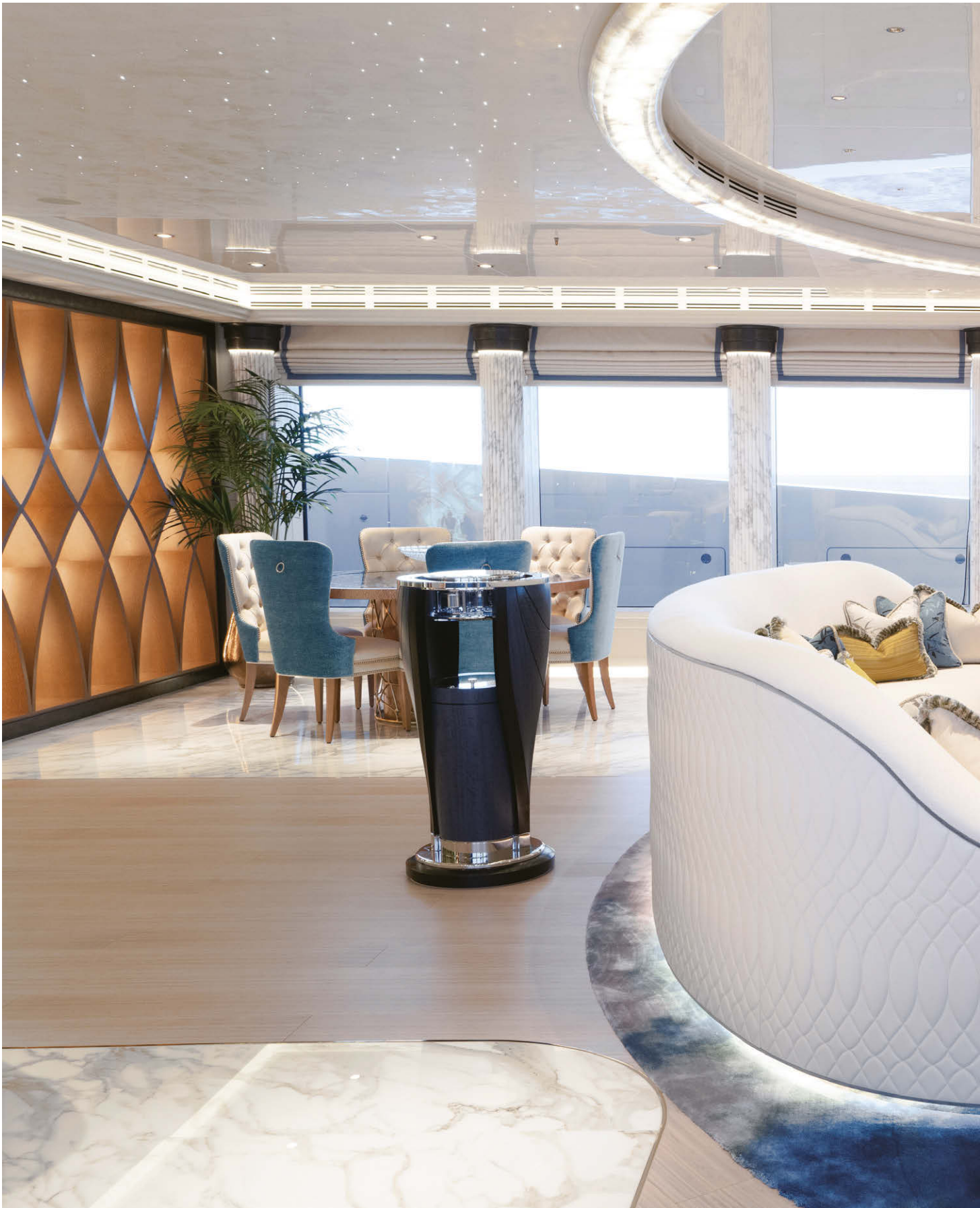
由Nuvolari-Lenard設計的私人遊艇 Prismatic I，來自Chroma系列 以絲綢手工簇絨製成