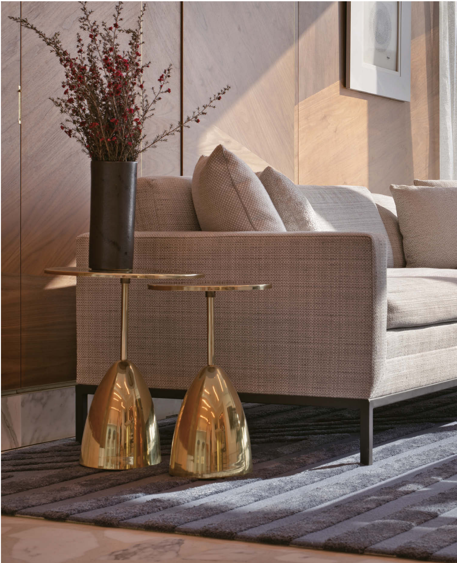
由Strang Interior Design設計，位於佛羅里達州邁阿密的私人住宅起居室 Embassy Court ，來自Edward Fields的Archive Edition 以羊毛及無光絲綢手工簇絨製成