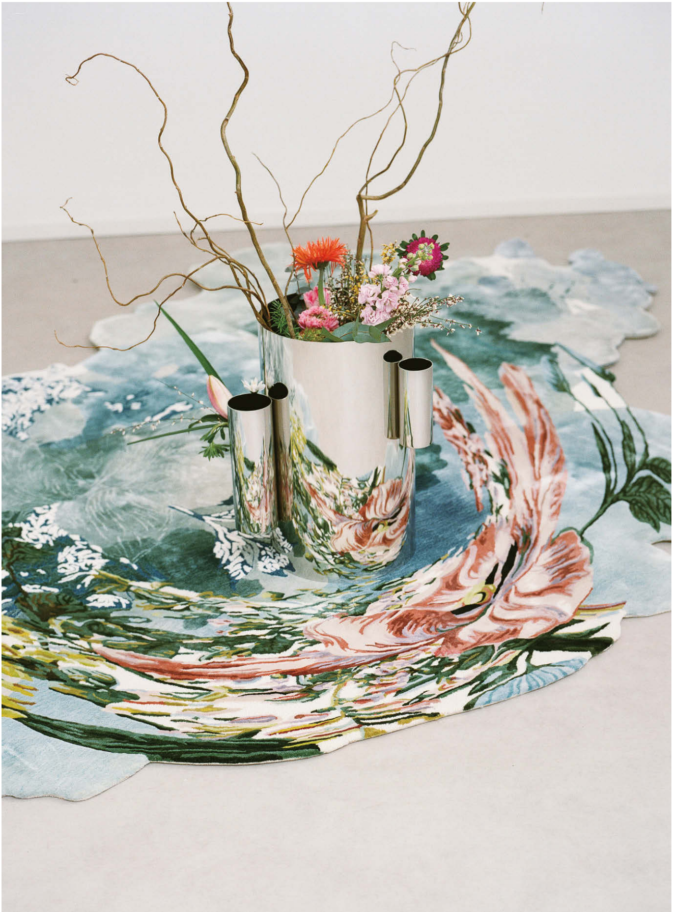
Anamorphosis，來自Sam Baron設計的Floræ Folium，在米蘭國際家具展2022期間於太平展廳陳列 以精緻絲綢、半精紡羊毛及Field手工簇絨製成