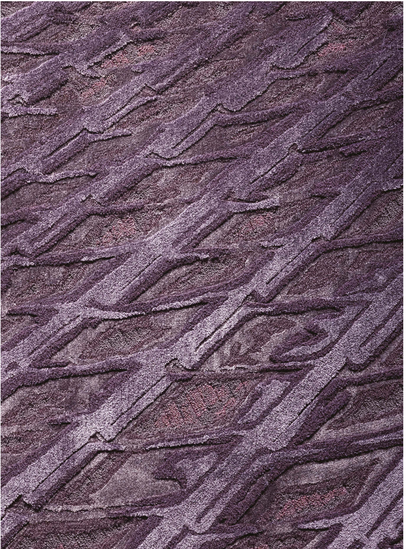
香港故宮文化博物館禮堂入口 Convergence ，由傅厚民為太平設計 以羊毛及Steele手工簇絨製成