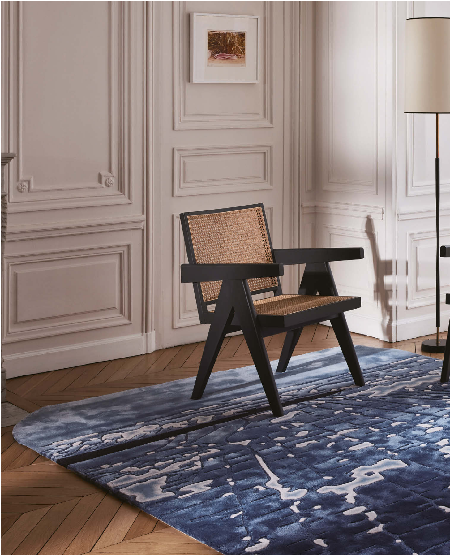
Mulholland I · 來自Elliott Barnes為太平設計的Overview系列 以羊毛及精緻絲綢手工簇絨製成