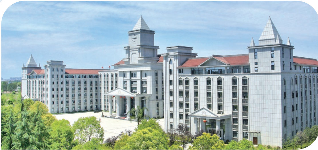
四川學校和平大樓