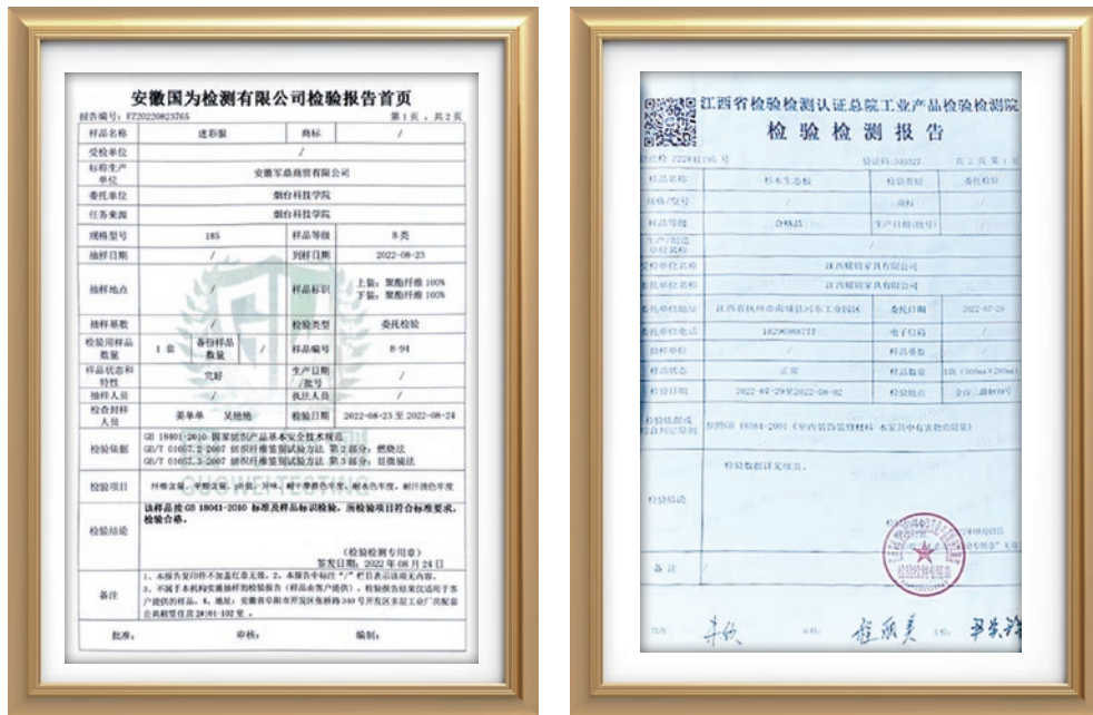
(左圖)山東學校軍訓服裝，會要求供應商提供面料甲醛檢測項目的檢測報告 (右圖)重慶學校的學生公寓床，會要求供貨商做有害物質限量的檢測報告

然後，我們會針對不同產品要求供貨商提供質檢報告、合格證明、樣品等有關資料用於驗收環節的質量控制。例如，在採購學生床上用品等物資時，我們要求供貨商提供政府機關出具的質量檢測證書/報告；在採購傢俱、電器、教學設備等都會查驗供貨商提供的產品合格證明。