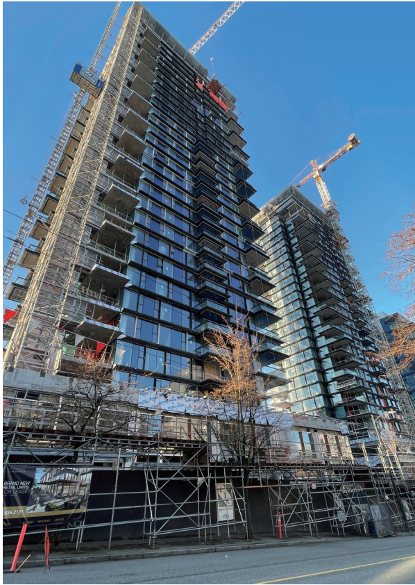
位於加拿大溫哥華「Landmark on Robson」發展項目

重估收益淨額錄得 68,000,000 港元(二零二一年：358,000,000 港元)，當中已計及集團應佔一間聯營公司所擁有之投資物業。