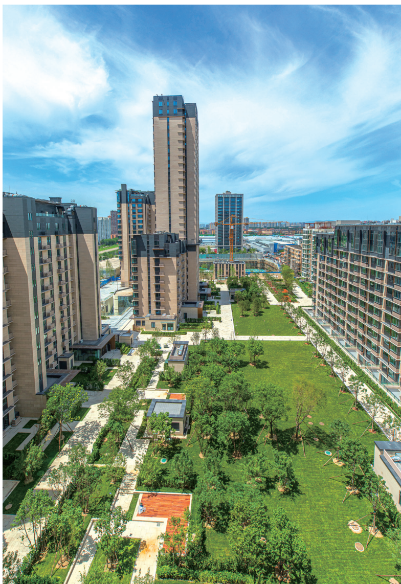
位於通州項目「北京·東灣」

本集團於財政年度上半年錄得收入1,202,000,000港元(二零二一年：1,430,000,000港元)，而本公司股東應佔虧損為37,000,000港元(二零二一年：溢利44,000,000港元)。期內，本集團於北京的合營企業向購房者交付已竣工單位，並開始確認溢利。儘管受到2019冠狀病毒病的持續困擾，酒店業務仍有改善，並為本集團帶來正面貢獻。但是，來自投資組合的投資收入減少連同按市值計價的未變現虧損淨額及預期信貸虧損額外撥備均導致本集團於中期期間錄得虧損。