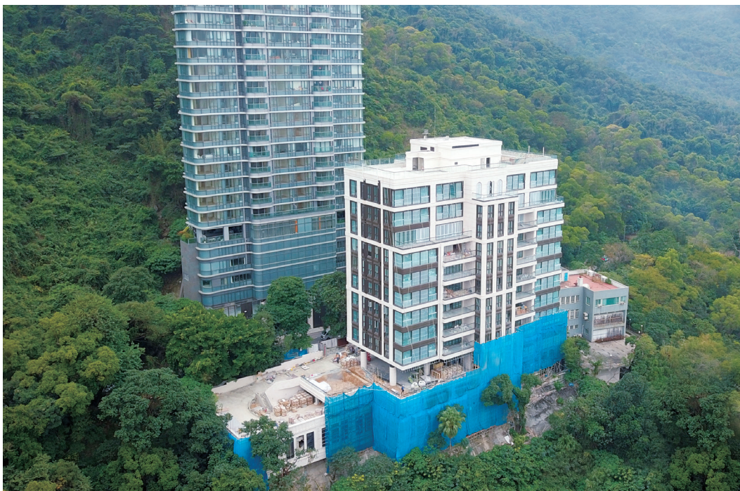
位於港島西半山寶珊道之豪華住宅發展項目

我們位於屯門藍地輕鐵站旁之另一項住宅發展項目正繼續向政府申請換地。根據現有分區參數，發展項目將提供約67,000平方呎之住宅樓面面積，而本集團已在新的換地申請中建議提高地積比率，以更好、更充分地利用該地塊。