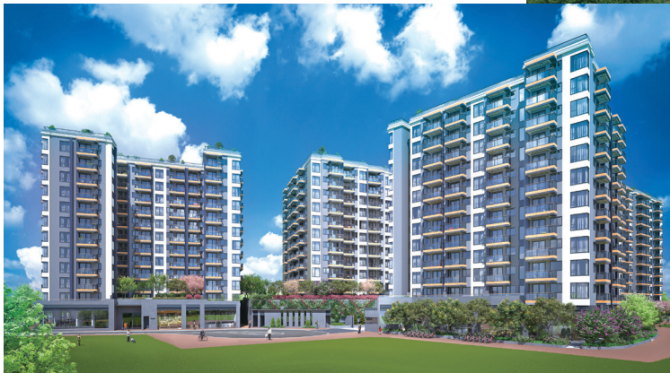
位於洪水橋住宅發展項目