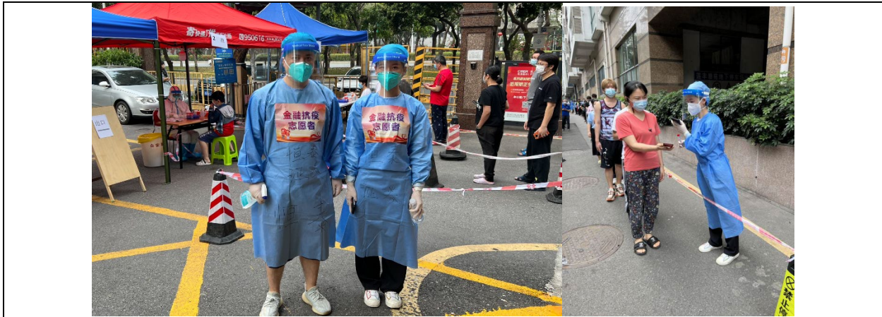
協助社會防控疫情