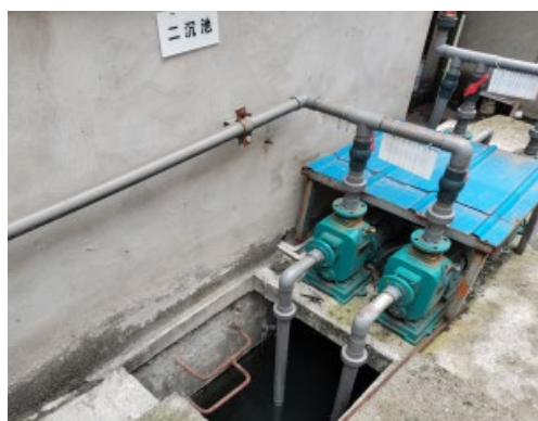
圖二 集水池提升泵