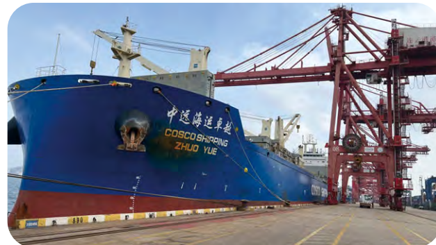
連雲港新東方碼頭與航運公司深化合作，開展紙漿進口業務。