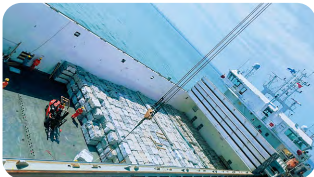
本年度，晉江太平洋碼頭開拓新業務貨種和歐洲航線，首次將花崗岩石製品裝船出港至荷蘭和德國。

本公司積極發揮全球碼頭佈局的優勢，與航運聯盟和碼頭運營商緊密合作，不斷開拓新航線，助力船公司織密航線網絡，加強港航協同。本年度，CSP阿布扎比碼頭、天津集裝箱碼頭、晉江太平洋碼頭等多家控股碼頭都成功新增航線，並積極爭取新業務貨種，為客戶進出口提供新選擇，進一步吸引船公司掛靠。