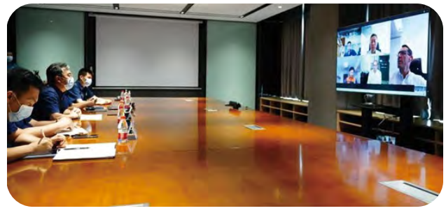
CSP西班牙相關公司與天津集裝箱碼頭舉行連線交流會，就碼頭運營模式和自動化建設等方面進行深入交流。