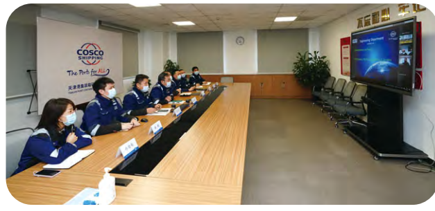
天津集裝箱碼頭與比雷埃夫斯碼頭舉辦視頻分享會，交流目前設備現狀和維修項目的規劃，就自動化設備和自動定位技術研發提出可互相借鑒的技術方案。

本年度，CSP武漢碼頭成功複製應用無人集卡項目，實現常態化作業目標。CSP阿布扎比碼頭亦在中東地區率先引入無人集卡，並開展實船全場作業。本公司將會繼續總結廈門遠海碼頭和天津集裝箱碼頭在數字化和智慧化建設的成功經驗，持續研究最具經濟效益的傳統碼頭自動化升級改造方案，並適時在其他控股碼頭進行推廣複製，累積智慧港口發展成果。