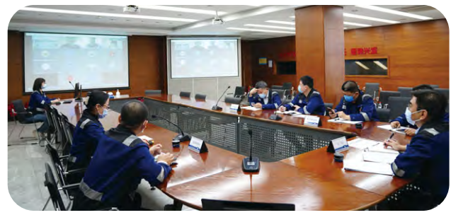
天津集裝箱碼頭與客戶就陸運業務進行交流，聽取客戶建議，完善服務流程。