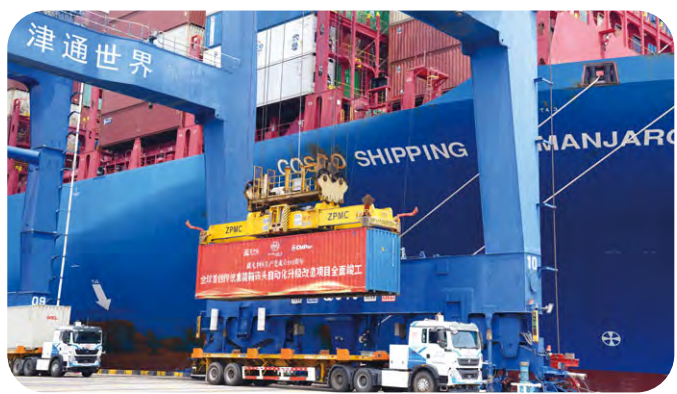
天津集裝箱碼頭實現全自動作業模式，大幅提高生產運行的便捷性和安全性。

本年度，天津集裝箱碼頭全球首創傳統集裝箱碼頭全流程自動化升級改造項目全面竣工，在傳統集裝箱碼頭的基礎上，通過自動化遠程岸橋、無人駕駛電動集卡、自動化軌道橋和智能鎖站，實現全自動作業模式，為全球港口提供了自動化升級改造的系統性解決方案。與傳統人工作業相比，全流程自動化平均作業效率得以提升，同時降低平均單箱能耗和綜合運營成本，進一步加快智慧綠色港口的建設步伐。目前，天津集裝箱碼頭北區四個泊位已全部實現高效自動化作業，是全球投產最早、建成規模最大的自動化集裝箱碼頭。本年度，天津集裝箱碼頭5G智慧港口項目入選2022世界5G大會的「年度十大應用案例」，樹立了傳統碼頭智能化改造的新標桿。