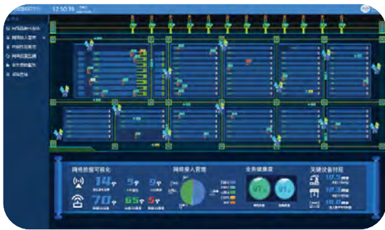
廈門遠海碼頭採用5G獨立組網架構，實現港區5G專網，保障信息傳輸安全可靠。

本公司積極加快技術突破和創新步伐，致力於提升碼頭服務質量和業務運營的可持續性。本年度，廈門遠海碼頭完成軟件使用測試評估和運行環境安全評估，啟用港區自動引導小車智能健康診斷與故障診斷軟件。通過無線通訊自動連接港區自動引導小車，軟件能夠快速定位核心部件故障位置和分析故障類型，大幅縮短故障定位時間，加快維護速度，有助於保證船舶自動化作業不間斷。