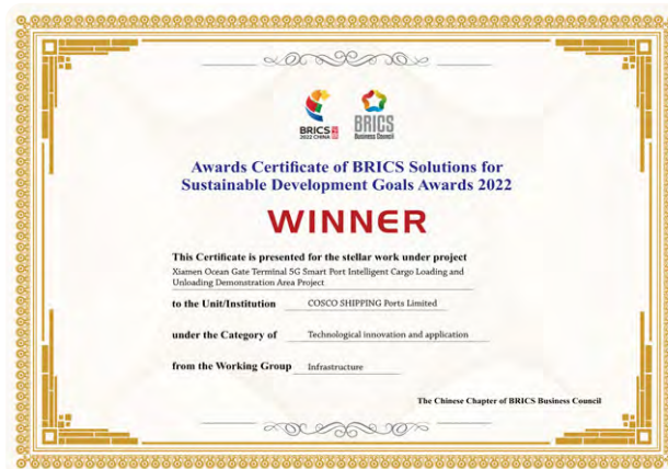
2022年7月，本公司5G智慧港口廈門遠海碼頭智能裝卸示範區項目獲得「金磚國家可持續發展目標解決方案大賽技術創新與應用類優勝獎」。

本公司智慧港口建設和科技創新應用取得進一步成果，本年度獲得金磚國家可持續發展目標解決方案大賽技術創新與應用類優勝獎、衛星導航定位創新應用白金獎等一系列獎項。