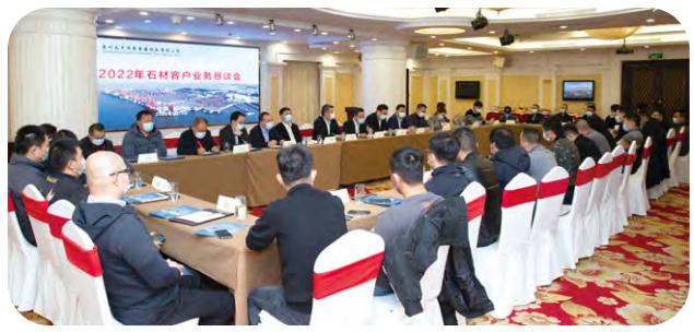
泉州太平洋碼頭召開業務懇談會，聽取客戶的寶貴意見，並介紹客戶服務舉措和未來的業務規劃。

本年度，本公司修訂完善《客戶服務管理辦法》和《客戶服務熱線受理辦法》，規範附屬控股碼頭的客戶管理和維護、客戶服務保障以及投訴和爭議處理工作，建立高水平的對外服務標準，提升客戶對本集團的信任。本公司及附屬控股碼頭定期通過問卷調查、會議、商務拜訪、座談會、博覽會等不同渠道，向客戶分享最新的業務發展資訊，並深入了解客戶的建議和期望。本年度，本公司及附屬控股碼頭完成客戶滿意度調查，分別100%及99.3%的受訪客戶表示滿意，反映客戶高度認可本集團的服務質量。