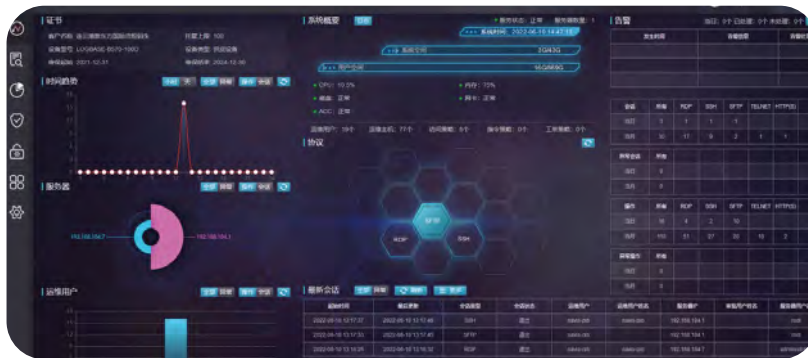
連雲港新東方碼頭完成網絡安全建設升級， 避免信息系統受到惡意攻擊、非法訪問和非法連接。

本公司亦會組織附屬控股碼頭進行網絡安全漏洞整修，防範系統安全方面的潛在風險，確保公司和客戶信息受到保護。本公司與附屬控股碼頭共享情報，封堵惡意攻擊，處理各類漏洞信息。為了防範釣魚攻擊，本公司組織附屬控股碼頭參加釣魚宣貫培訓。本年度，本公司沒有涉及任何洩露客戶信息的個案。