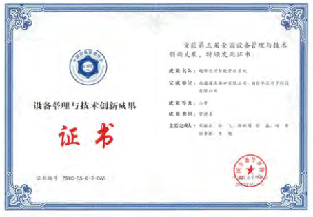
2022年，南通通海碼頭的「超限治理智能管理系統」獲得全國設備管理與技術創新成果獎項。