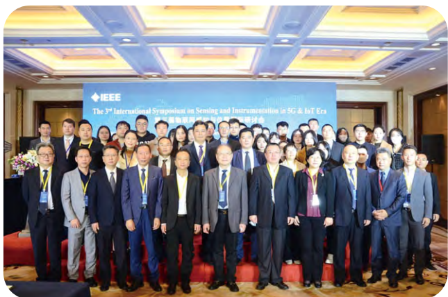
第三屆物聯網感知與儀器國際研討會召開，探討自動化碼頭前沿技術。

本公司積極推動碼頭技術的發展，為港口碼頭的建設提供新動力。本年度，本公司協辦第三屆物聯網感知與儀器國際研討會，匯聚近200名來自國內外高校、科研機構和企業的代表就智慧港口、自動化碼頭數字孿生、自動化碼頭仿真、設備自動化與運維、自動化碼頭操作系統(TOS)、U型自動化碼頭等領域的前沿理論與技術進行研討與交流。