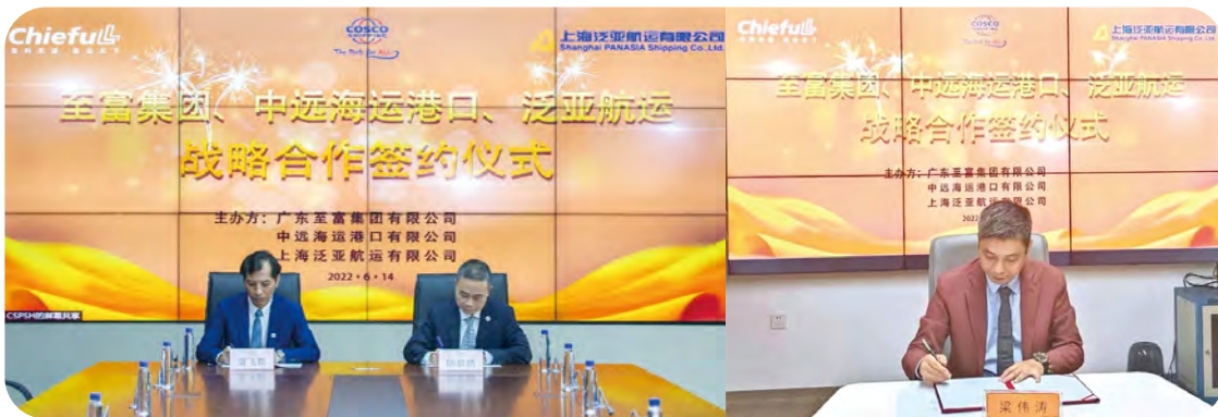
本公司與船公司及貨主共建「港航貨」一體化的合作機制。

此外，本公司積極發揮資源優勢，與港務集團、船公司和貨主進行產業鏈合作。本年度，本公司與上海泛亞航運有限公司及廣東至富集團有限公司達成戰略合作協議，在集裝箱運輸、港口及配套延伸服務、端到端全程物流方案諮詢、技術合作及物流產業鏈等多個領域展開深度戰略合作，充份發揮各自領域的優勢，快速打通供應鏈上下游物資流通，輸出產業物流解決方案，進一步深化產業鏈協同，共同助力物流效率提升。在三方戰略合作框架下，泉州太平洋碼頭與廣東至富澱粉供應鏈管理有限公司簽署合作意向協議書，開展圍繞至富(泉州港)澱粉智能配送中心在碼頭作業、倉儲配送、物流技術解決方案、服務推廣等澱粉銷區物流供應鏈服務方面的緊密合作關係。