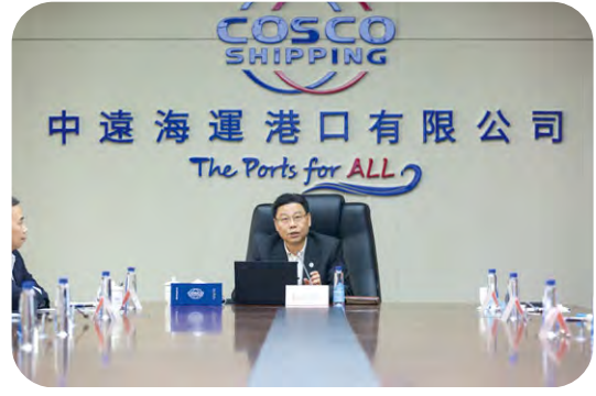
CSP武漢碼頭與港務集團展開戰略合作，推動港口發展。

本年度，錦州新時代碼頭與兩家物流公司就西南流向的鈦礦在錦州口岸上岸及倉儲物流等供應鏈延伸服務項目達成合作，讓鈦礦通過「散改集」方式運至錦州，並在錦州新時代碼頭開展鈦礦整箱直提、場站拆箱、自卸倉儲等多種形式的碼頭延伸業務。後續，港航企三方將進一步協同合作，開發下游冶煉企業的適箱貨源集裝箱海運服務。