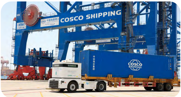
CSP阿布扎比碼頭開啟了中東地區碼頭首次無人駕駛集卡實踐。