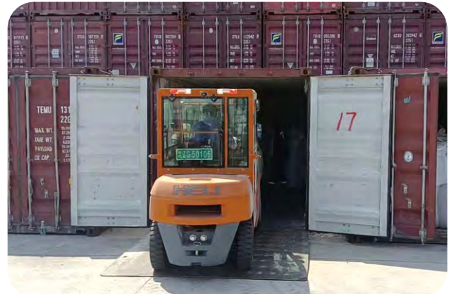
錦州新時代碼頭與物流公司就供應鏈延伸服務項目達成合作。