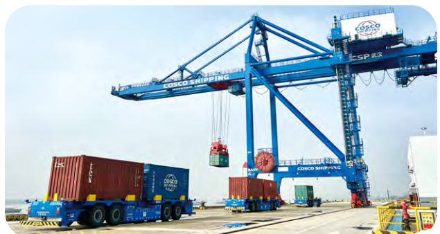
CSP武漢碼頭無人駕駛集卡已投入作業。

此外，廈門遠海碼頭、天津集裝箱碼頭、CSP武漢碼頭及CSP阿布扎比碼頭都已引入純電驅動的無人駕駛集卡，相比傳統的燃油集卡，可以降低能耗及減少碳排放，是本公司建設綠色智慧港口的重要技術組成部份。