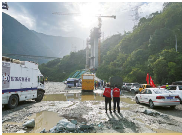
人保財險迅速應對四川甘孜州瀘定縣6.8級地震