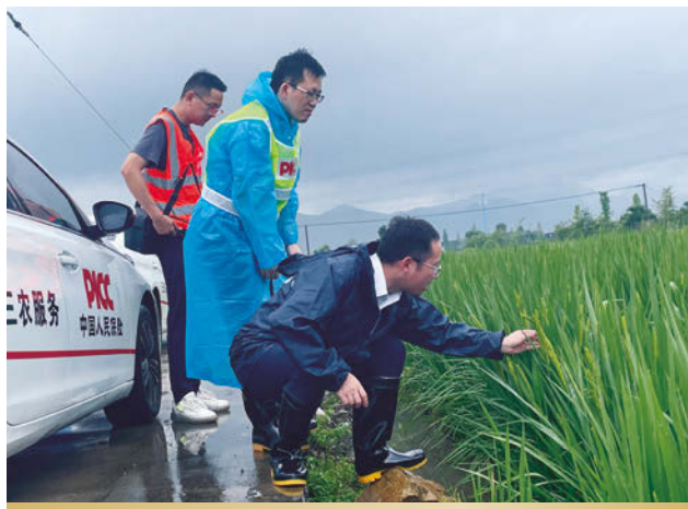
人保財險服務「梅花」颱風救災理賠

受人傷賠償標準上漲以及歷史業務賠付責任的影響，責任險整體賠付率76.2%，同比上升8.3個百分點；同時，人保財險加強客戶群分類管理，強化渠道管理，精準配置資源，責任險費用率36.6%，同比下降2.9個百分點；綜合成本率112.8%，同比上升5.4個百分點。