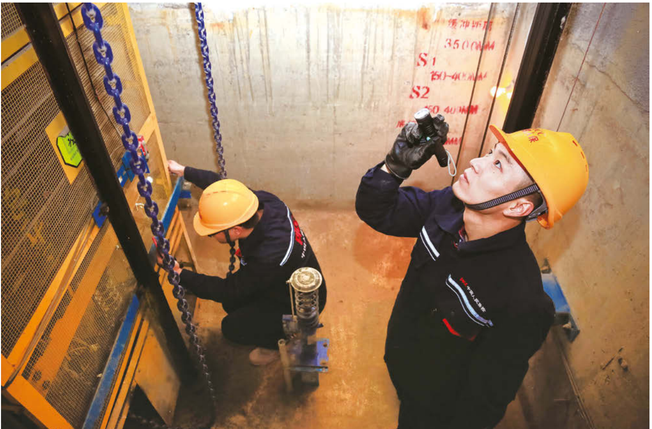
人保財險定期對電梯進行全面「體檢」和監測

人保財險深入服務社會治理，護航大國重器，持續加大產品創新和推廣力度，其他險實現總保費收入148.64億元，同比增長5.4%。