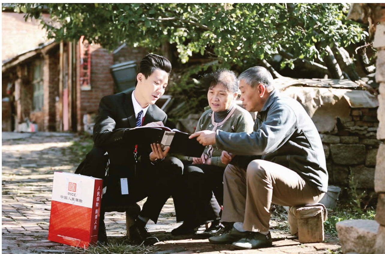
人保壽險為農村地區居民打造「親民保」惠民人身險產品