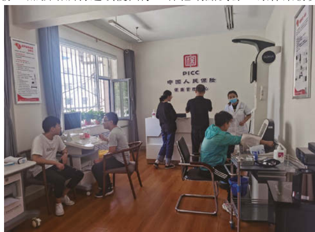
人保健康舉辦客戶健康體驗專場活動

按規模保費統計，2022年，個人保險渠道、銀行保險渠道、團體保險渠道分別實現規模保費187.15億元、86.54億元、138.96億元。