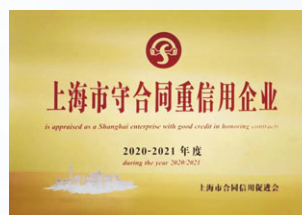
上海市守合同重信用企業