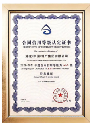
上海市年度合同信用認定AAA企業