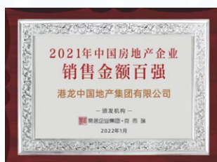
中國房地產企業銷售金額百強