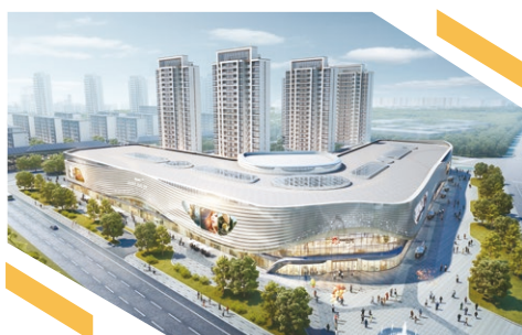
無錫宜興寶龍廣場