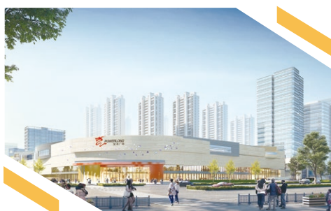
珠海高新寶龍廣場