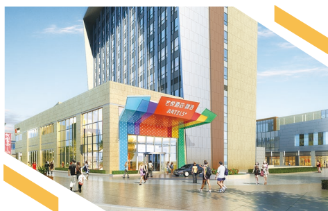
上海臨港藝悦精選酒店