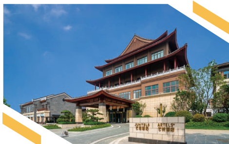
煙台蓬萊藝悅／藝瑤酒店