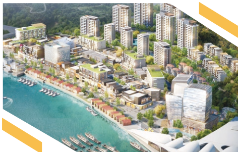
舟山普陀寶龍廣場