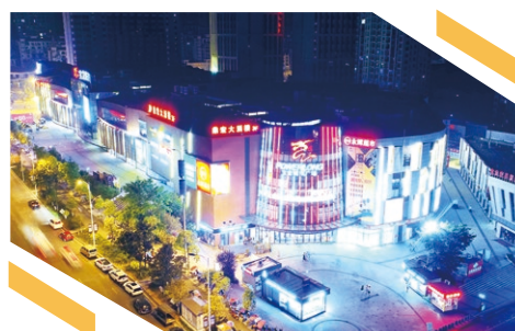
重慶合川寶龍廣場