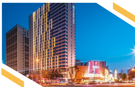
重慶合川藝悅精選酒店