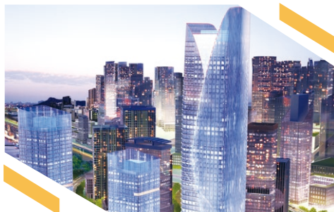
天津濱海寶龍廣場