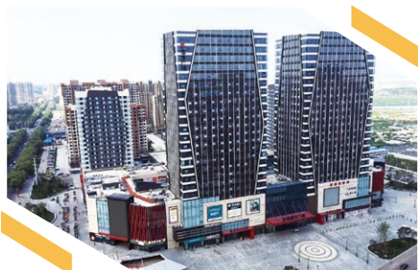
青島膠州寶龍廣場