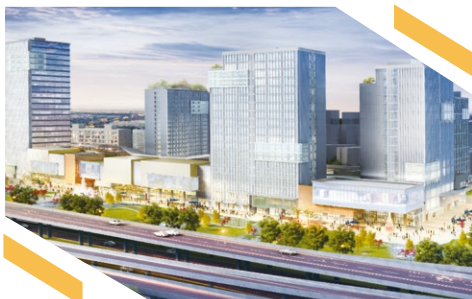
上海寶楊寶龍廣場