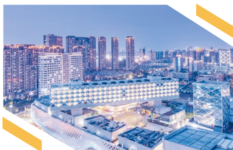
杭州濱江藝瑤酒店