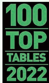
《南華早報》 二零二二年度 100 Top Tables