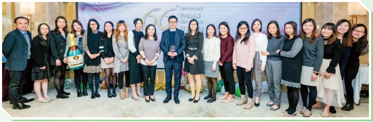
▲二零二二年度週年晚宴