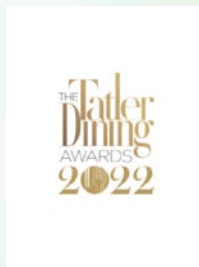
The Tatler Dining Awards 2022