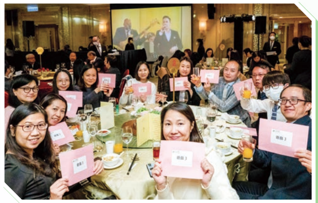
▲二零二二年度週年晚宴

本集團絕不容忍員工因性別、婚姻狀況、膚色、宗教、種族、國籍、族裔、殘疾或年齡而受到騷擾及歧視。本集團已於二零二二年採納舉報政策，向其僱員及與本集團有業務往來的第三方(例如顧客、租客、承包商及供應商)提供透過填寫舉報表格報告本集團內部任何涉嫌不當行為、失當行為或舞弊行為的舉報渠道及指引。所報告事宜的資料將予以保密。本公司的商業道德委員會將審閱及調查所報告的事項，並釐定必要的糾正措施。於報告年度，概無向本集團舉報該等事件。