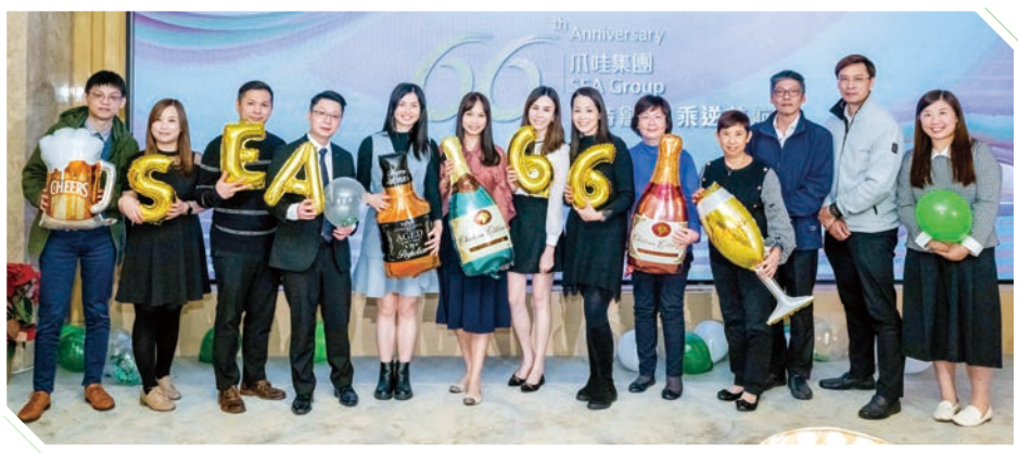
▲ 二零二二年度週年晚宴