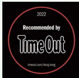
Time Out Recommended 2022