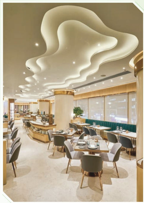
▲ CARVER，位於香港銅鑼灣皇冠假日酒店

作為餐飲業從業者，皇冠假日酒店深知賓客的福祉與彼等的健康及安全同樣重要。於二零二二年度內，皇冠假日酒店作為指定檢疫酒店接待了數千位隔離住客。為在隔離期間之住客提供獨特而正面的體驗，皇冠假日酒店提供免費禮品，包括清潔套裝、水果、甜點、小吃、歡迎餐及消毒套裝（包括口罩、消毒搓手液及抗菌噴霧）。皇冠假日酒店亦為住客提供素食及植物性膳食選擇。