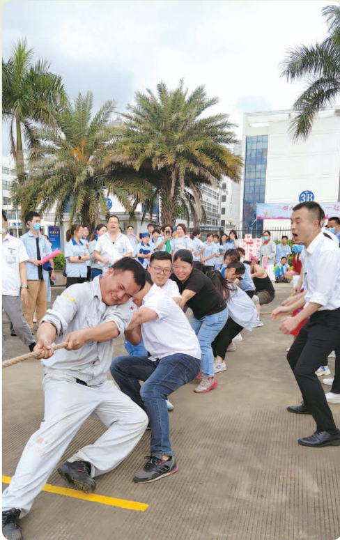
於二零二二年五月舉辦拔河比賽。