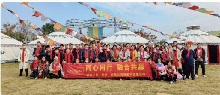
於二零二二年十二月舉行團建 活動「野餐」。