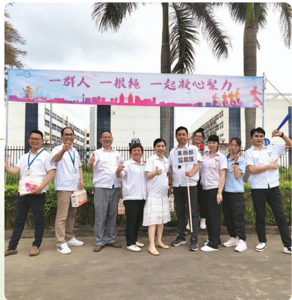
於二零二二年五月舉辦拔河比賽。