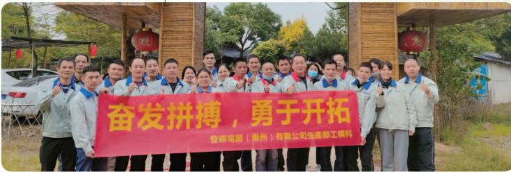
於二零二二年十二月舉行 團建活動「遠足」。