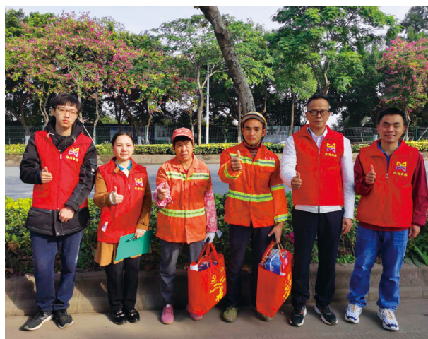
春節前慰問環衛工人

我們亦關心環境，例如於報告年內舉辦植樹活動，不但幫助綠化環境，更提高員工環境保護的意識。