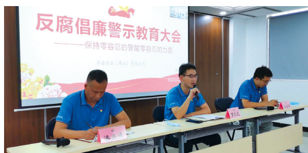
反腐倡廉警示教育活動

為實現廉潔從業的有效監督，我們制定了內部監督舉報相關文件，明確了違反公司廉潔從業有關制度規定的處分措施包括：口頭提醒、口頭批評、書面警告、調崗、降職、追繳、索償，直至解除僱傭合約；涉嫌違法犯罪的，將由公司移交司法機關處理，對公司處理或處分決定不服者，可向公司有關部門提出申訴。同時，我們對廉潔從業有關問題舉報途徑進行了公示，員工可經本集團提供的舉報渠道，包括郵寄及電郵，對利用職務謀取個人私利、賄賂、勒索、欺詐及洗黑錢等違紀違法的行為進行通報，若經調查後確認，本集團將把相關資料及情況交由當地執法機關處理。我們承諾對所有身份及信息嚴格保密，並強調參與任何類型的貪污或賄賂活動的行為奉行零容忍政策。