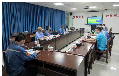
企業特殊作業安全規範培訓

2022年新型冠狀病毒疫情持續，本集團積極配合國家及當地政府的防控要求，加強科學宣傳，引導員工自覺遵守防疫規定，做好個人防護和健康監測。我們鼓勵符合新冠疫苗接種條件的員工及員工家屬接種新冠疫苗。