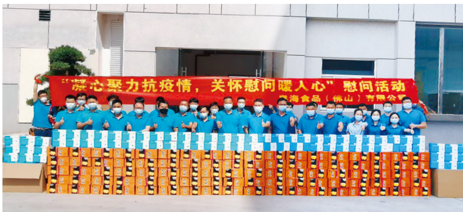
「凝心聚力抗疫情，關懷慰問暖人心」慰問活動 為一線職工送上抗疫口罩和慰問品

本集團於內地亦主動承擔起抗疫保供的職責，全力保障內地社區群眾鮮活物資、生活物資供應充足和穩定安全。2022年11月初，內地疫情高發，粵海食品佛山提前啟動抗疫保供預案，對內開展相應培訓，對外提高供應鏈運作效率，並積極與政府相關防疫部門和相關管理部門及時溝通，成功獲得「保障群眾生活必需品物資企業證明」資質。為精準滿足內地社區群眾需求，粵海食品佛山在保障民生供應的同時避免造成生鮮食材的過度浪費損耗。