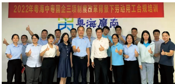
勞動用工合規培訓