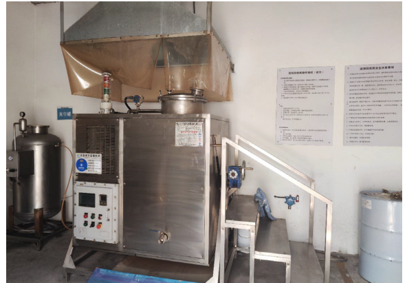
廢天那水回用裝置

本集團定期接受地方政府檢測，並委託第三方機構進行廢水檢測，確保達標排放。本集團每週對馬口鐵業務產生的廢水進行化學需氧量和PH值自測；每季度委託有當地環保認證的公司進行廢水檢測。檢測的主要內容為pH值、化學需氧量、氨氮、總磷、總氮、總鉻等，檢測結果始終符合法規要求的標準。當地環保部門還將通過污水在線監測設施實時監測廢水污染含量，每年不定期檢查廠區污水排放情況，監督馬口鐵企業的廢水排放情況。此外，本集團嚴格於各生產車間及污水處理站執行《環保叫停作業指導書》，以預防因操作失誤或突發事件導致廢水超量排放而造成的環境污染事故。