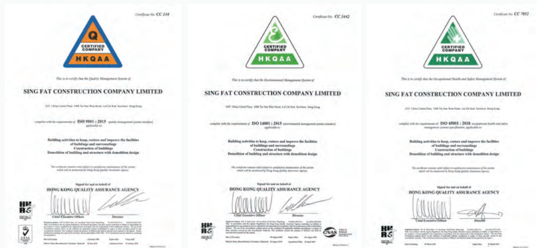
ISO 9001質量 管理體系

本集團深知其業務對社區及環境的影響。為減輕本集團營運所產生的環境影響，本集團已參考ISO14001環境管理體系，採納及實施相關環境政策。本集團於本匯報年內並不知悉嚴重違反香港環境保護法例的情況，包括但不限於香港法例第311章《空氣污染管制條例》、香港法例第354章《廢物處置條例》、香港法例第358章《水污染管制條例》以及香港法例第400章《噪音管制條例》。