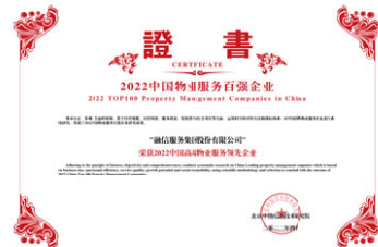
2022中國物業服務百強企業研究成果發佈 「2022中國高端物業服務領先企業」