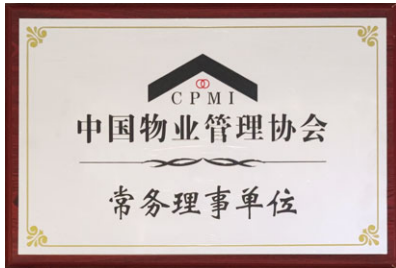
中國物業管理協會 常務理事單位