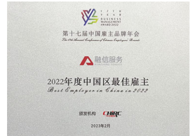
第十七屆中國僱主品牌年會 「2022年度中國區最佳僱主企業」