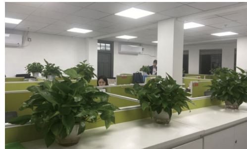
辦公室裏所種植的綠色植物

疫情方面，本集團採取多項疫情防控措施讓員工遵照以降低僱員感染風險，保障全體員工的衛生、健康和安 全。疫情防控措施包括定期開展辦公環境消毒活動；配合政府部門發佈定期核酸檢測通知；及時關注並跟進 員工防疫核酸及健康碼動態；開展疫情期間員工防疫物資發放慰問活動，做好居家隔離期間生活物資保障。 此外，我們更成立了「居家援助團」，隨時接待員工的防疫生活等各類求助解答與協助解決，全力保障員工共 同抗疫。