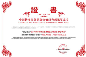
2022中國物業服務品牌價值研究成果發佈 「2022中國物業服務特色品牌企業— 智慧物業」