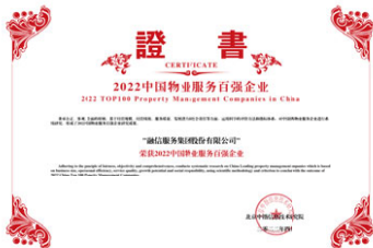
2022中國物業服務百強企業研究成果發佈 「2022中國物業服務百強企業」