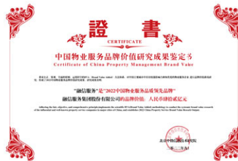
2022中國物業服務品牌價值研究成果發佈 「2022中國物業服務品質領先品牌— 品牌價值42億元」