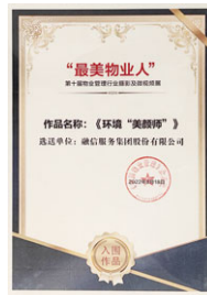
第十屆物業管理行業攝影及微視頻展 「最美物業人」