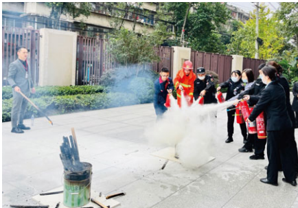
消防演習中消防員示範使用消防設備