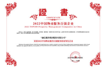
2022中國物業服務百強企業研究成果發佈 「2022中國物業服務百強服務質量領先企業」