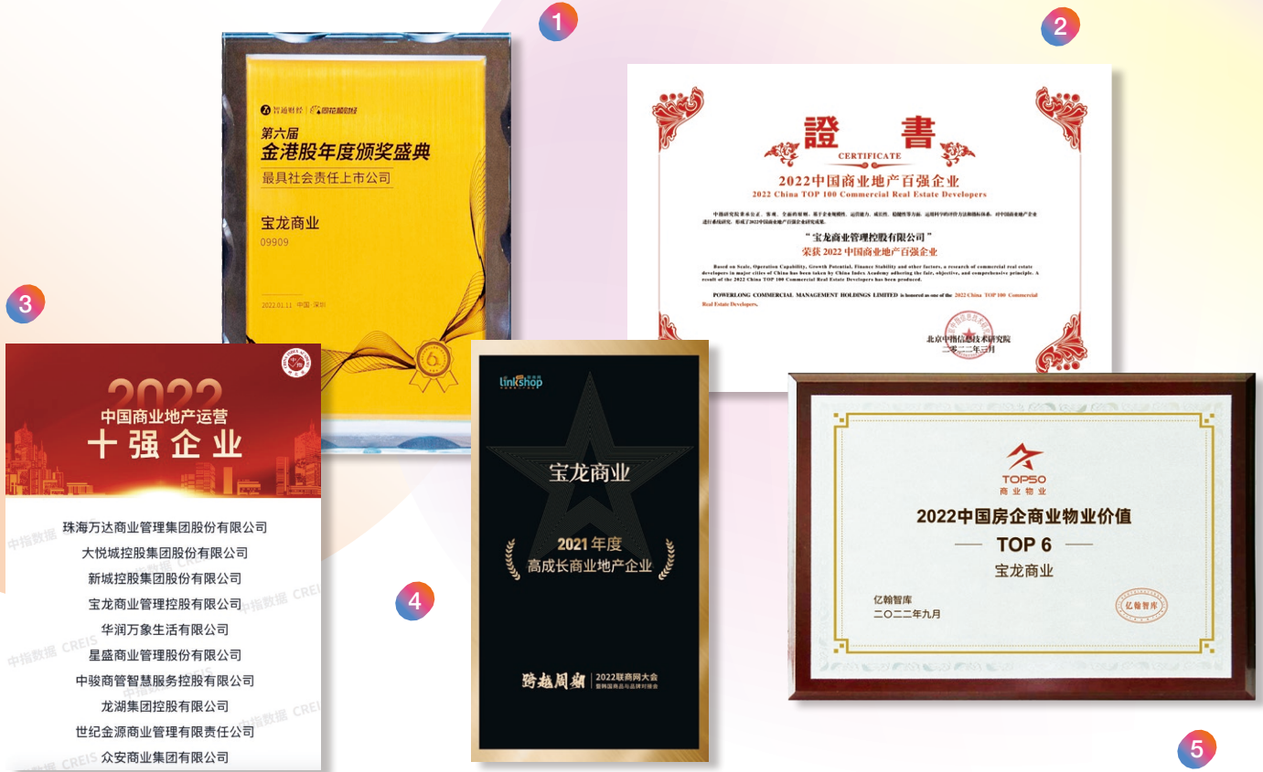
1 最具社會責任上市公司—智通財經