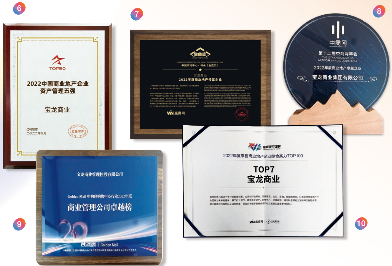
6 2022中國商業地產企業資產管理五強—億翰智庫