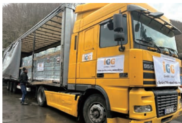
為地震災區捐贈救援物資