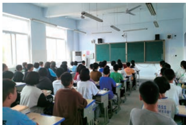
重建後的中國河南衛輝市第十中學教學樓