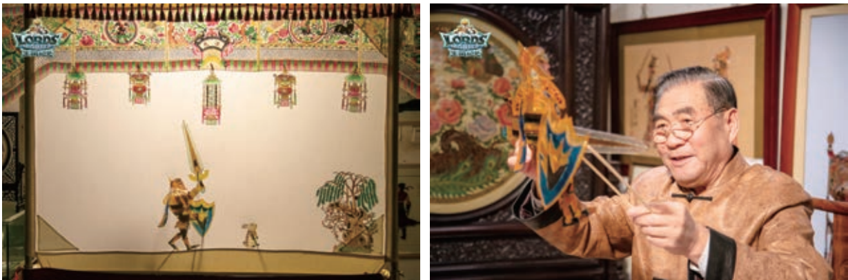
在遊戲中融入傳統文化元素

我們為員工自發組建的公益社群提供活動平台，定期舉行公益志願者活動，例如義賣等活動，通過跳蚤市場、銷售土特產品等方式為需要幫助的群體籌集善款。