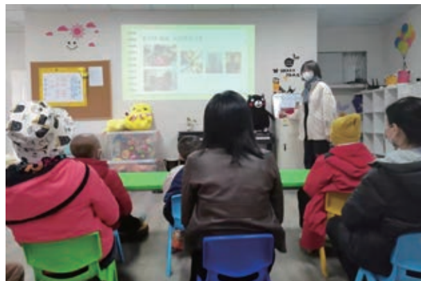
「病房教室」關愛白血病患兒