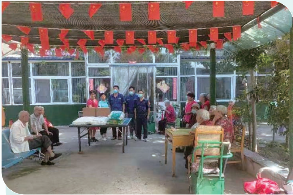
尊老敬老慰問活動

本集團各單位均為所在地街道、社區、政府部門各相關部門在安排人員就業、稅收繳納、扶貧等工作上給予大力支持，又積極參與當地修路、興修水利工程等公益事業，並與相關部門及單位建立了良好的合作關係。報告期內總義工服務時數超過300,000小時，所動用的總金額超過人民幣500,000元。