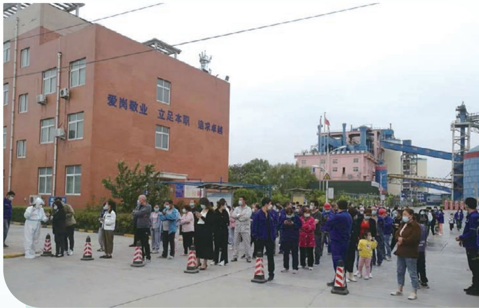
全員免費核酸檢測