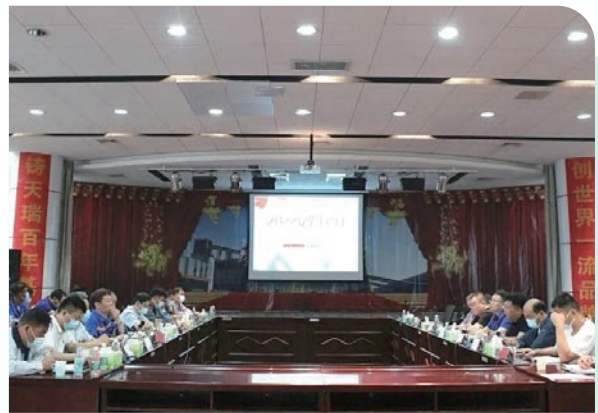
「安全生產月」宣傳教育活動