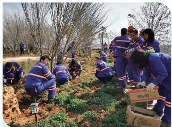
天瑞新登的植草綠化活動