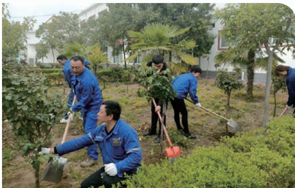
南召公司規劃在生活區綠化帶內種植 100 多棵高桿月季

本集團持續積極參與公共福利活動及支持扶貧的工作，以創造穩定及和諧的社區為願景。年內本集團得力於員工間的彼此協助，安排參加義務植樹活動，又慰問周邊困難群眾，為其送上節日問候及支援。