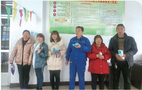
南召公司元宵佳節猜燈謎贏禮品活動