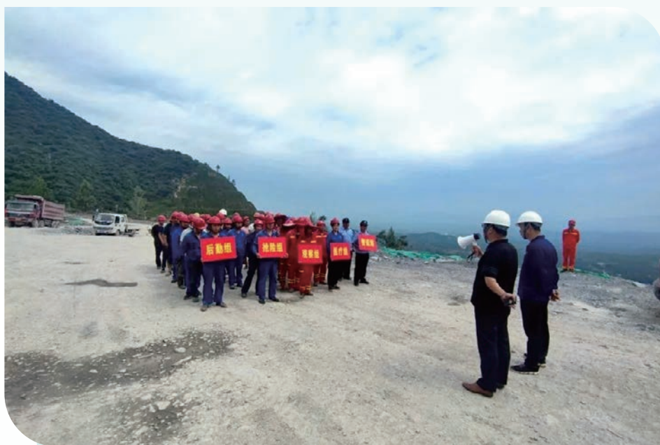
南召公司組織開展礦山綜合應急演練

生產單位在工作場所的高危地方設置有明顯危險作業告知卡例如在受噪聲、粉塵等影響職業健康安全區域張貼警示告知牌，告知員工工作程序中存在的點，提醒員工注意相關消除危險的操作和設施。生產單位每月又組織進行安全綜合大檢查活動，檢查排查各類安全隱患，並限期整改。