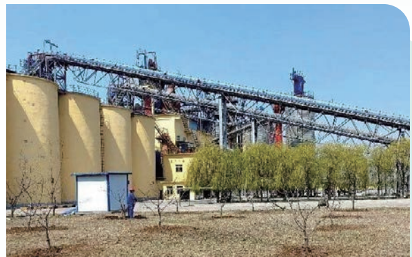
誠興公司捐獻的 20 棵蘋果樹順利移栽廠區內