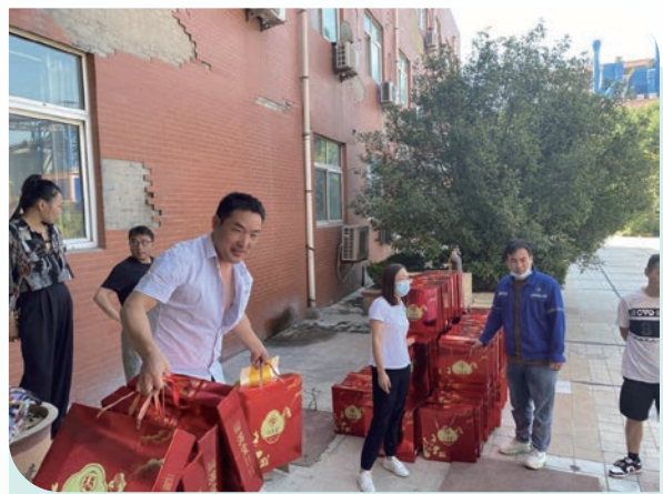
發放米、油、月餅等中秋福利