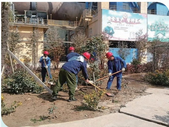
天瑞蕭縣水泥廣泛發動職工參與植樹綠化活動