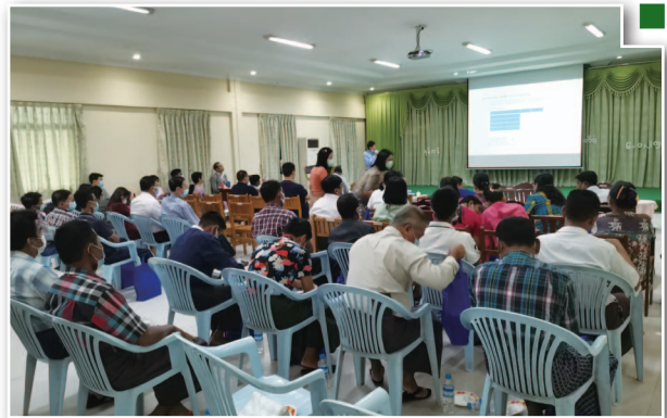
環境及社會影響評價溝通會 (EIASIA 溝通會)