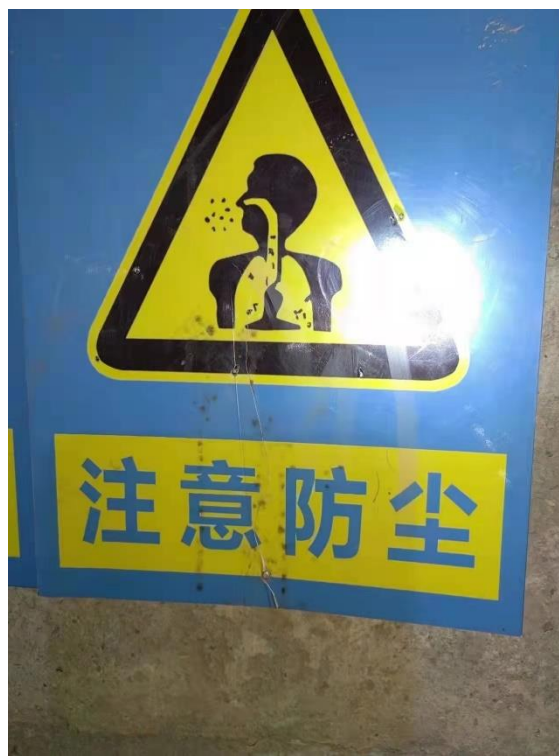
▲ 礦區內放置防塵警示牌