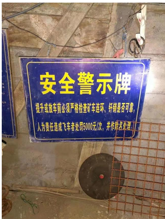
▲ 礦區內放置安全工作警示牌