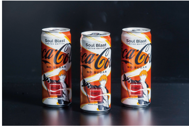
「可口可樂Soul Blast」x《BLEACH死神千年血戰篇》

於不同地區推出不同的活動及快閃商店獲得大量曝光率。我們在香港的LCX及K11的《咒術迴戰》快閃店、海港城的《芝麻街》商場活動及與Jon Burgerman聯乘的藝術展覽、印尼的《鯊魚寶寶》活動及台灣的《我的英雄學院》x《排球少年!!》快閃店。