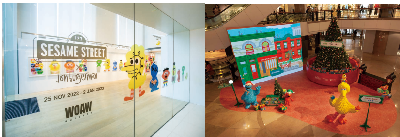
於香港的海港城的《芝麻街》商場活動及與Jon Burgerman聯乘的藝術展覽

於不同地區推出不同的活動及快閃商店獲得大量曝光率。我們在香港的LCX及K11的《咒術迴戰》快閃店、海港城的《芝麻街》商場活動及與Jon Burgerman聯乘的藝術展覽、印尼的《鯊魚寶寶》活動及台灣的《我的英雄學院》x《排球少年!!》快閃店。