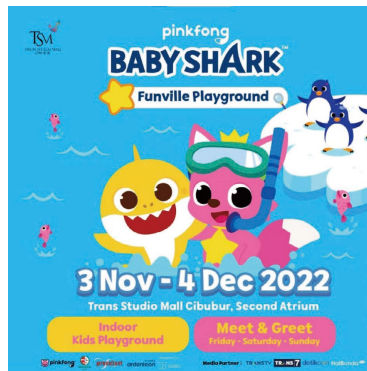
印尼的《鯊魚寶寶》活動