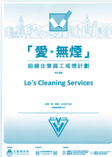
樂善堂頒發的「無煙海濱萬步行」感謝狀