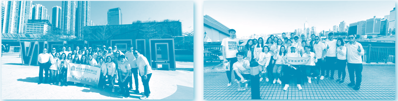
於二零二三年二月舉行的「無煙海濱萬步行」慈善步行活動

在本集團提供合約清潔服務的其中一個主要住宅項目，本集團每月進行回收活動，鼓勵住戶以玻璃瓶或罐、報紙、塑膠等回收物品換取由本集團贊助的消費品。已安排回收承辦商收集回收物品。