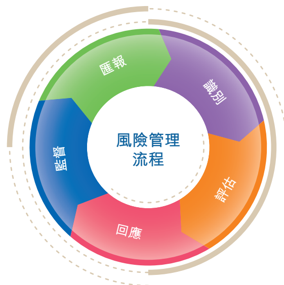
(圖一：風險管理流程)