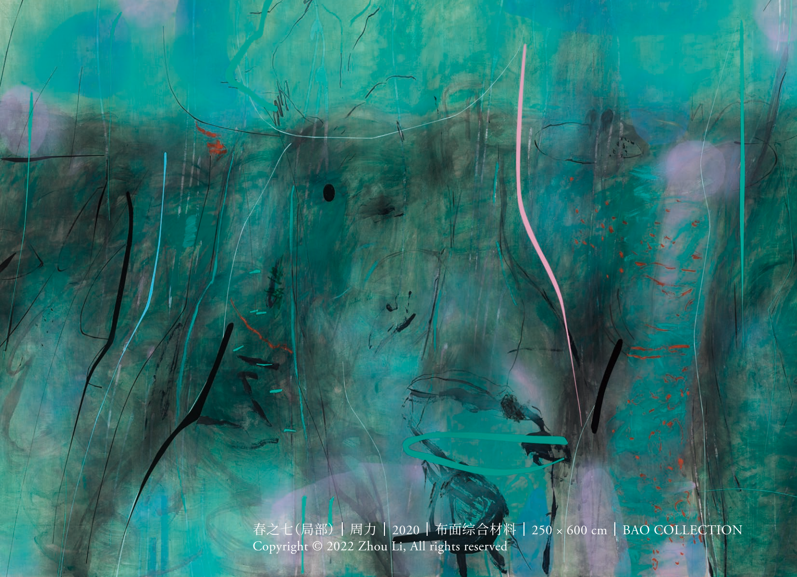
春之七(局部) | 周力 | 2020 | 布面综合材料 | 250 × 600 cm | BAO COLLECTION Copyright © 2022 Zhou Li, All rights reserved