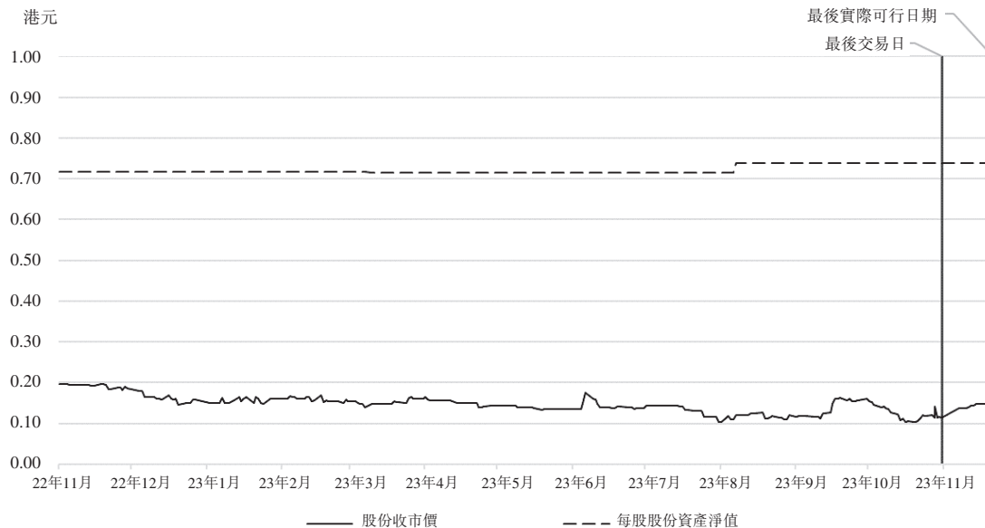
於回顧期間及直至最後實際可行日期股份收市價 相對每股股份資產淨值