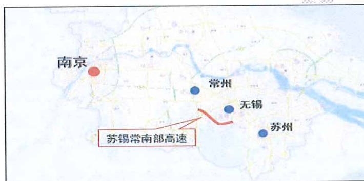
图 1.1 项目路在全省的地理位置图