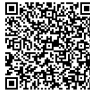
供下載申請表格的 二維碼